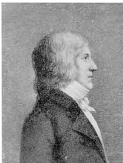
Malthe Conrad Bruun blev paa Grund af politiske Skriverier landsforvist. Under sit Ophold i Frankrig skabte han sig et Navn blandt Verdens førende Geografer.

Denne Mand har skabt sig et Navn af Verdensformat i Geografernes Rækker, men naar saa faa kender hans Livshistorie, kommer det af, at hans Navn har levet i Skyggen af en Landsforvisning, som republikanske Idéer skaffede ham. Det fortjener at blive æret og agtet, fordi han i Udlandet ofrede alt til Gavn for sit Fædreland.