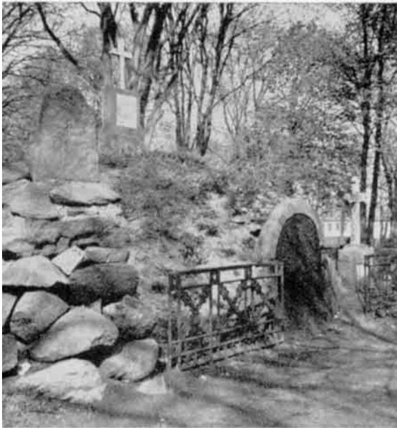
Paa Thisted gamle Kirkegaard findes en ejendommelig Gravhøj, der gemmer Støvet af de Medlemmer af Slægten Faye, som havde deres Virkeplads i Thy.