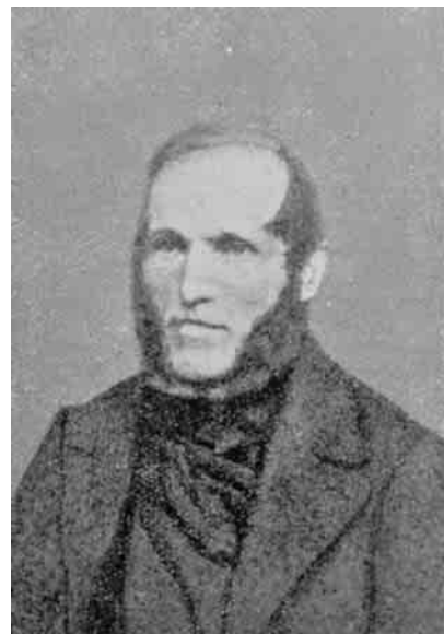
Christen Kold var i Paaklædning og Fremtræden yderst beskedent, men Ansigtet vidner om Intelligens og Viljekraft.