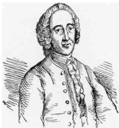
Jacob Langebeck blev født 1710 i Skjoldborg Præstegaard og naaede ved Flid og Dygtighed frem til de største Poster inden for dansk Historieforskning.