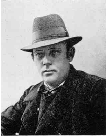
Ungdomsbillede af Johan Skjoldborg.