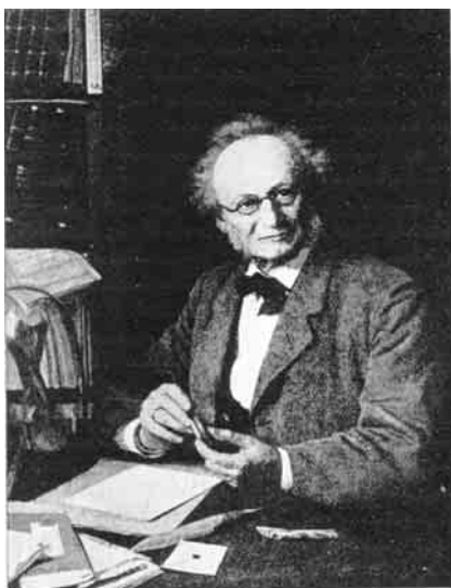
Japetus Steenstrup ved sit Arbejdsbord.