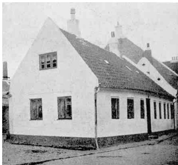
I et beskedent Hus, Skolestræde 8 i Thisted, fødtes J. P. Jacobsen d. 7. April 1847.

J. P. Jacobsen søgte Ministeriet om 2000 Kr. til Studieophold, men da det afsloges to Gange, ansøgte han om fast Digtergage, da han de sidste Aar kun havde haft ca. 2500 Kr. ialt at leve af. Dette blev ogsaa afslaaet, men man bevilgede ham een Gang for alle 1000 Kr. Dog lykkedes det i 1883 ved Venners Hjælp at faa Digtergage 1000 Kr. om Aaret, men da var han allerede dødsmerket. Aaret 1881 tilbringes i København, han blev stadig daarligere og skrev kun en enkelt Novelle "Pesten i Bergamo". I 1882 kom "Fru Fønns", en Afsked med Vennerne - og Livet!