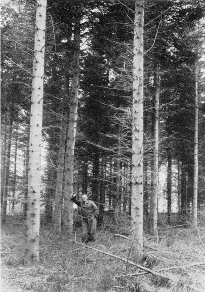
Fra Bohn-Jespersens Forsøg: Edelgran i Vilsbøl Plantage.

Jord. Begge Træarter kultiveres i Reglen ved Underplantning af den i Forvejen lyshuggede Fyr. Efterhaanden som de unge Træer vokser til, tyndes Bjergfyrren over Granerne eftersom dette skønnes tiltrængt af Hensyn til Lyset.