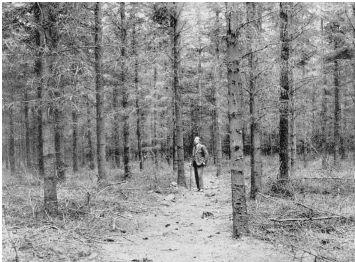
Sitkagran i Nystrup Plantage. (P. Thaarup fot.)

fundet sit Leje paa gammel Grund, der er Bjergfyrren af kummerlig Vækst - ja paa Klitten ud mod Havet er den endogsaa saa ussel, som det kan tænkes muligt, men den holder dog Livet. Derfor har Erfaringen lært Klitplantørerne, at man ikke skal gaa nærmere Havet end 1 km med Plantning af Træer.