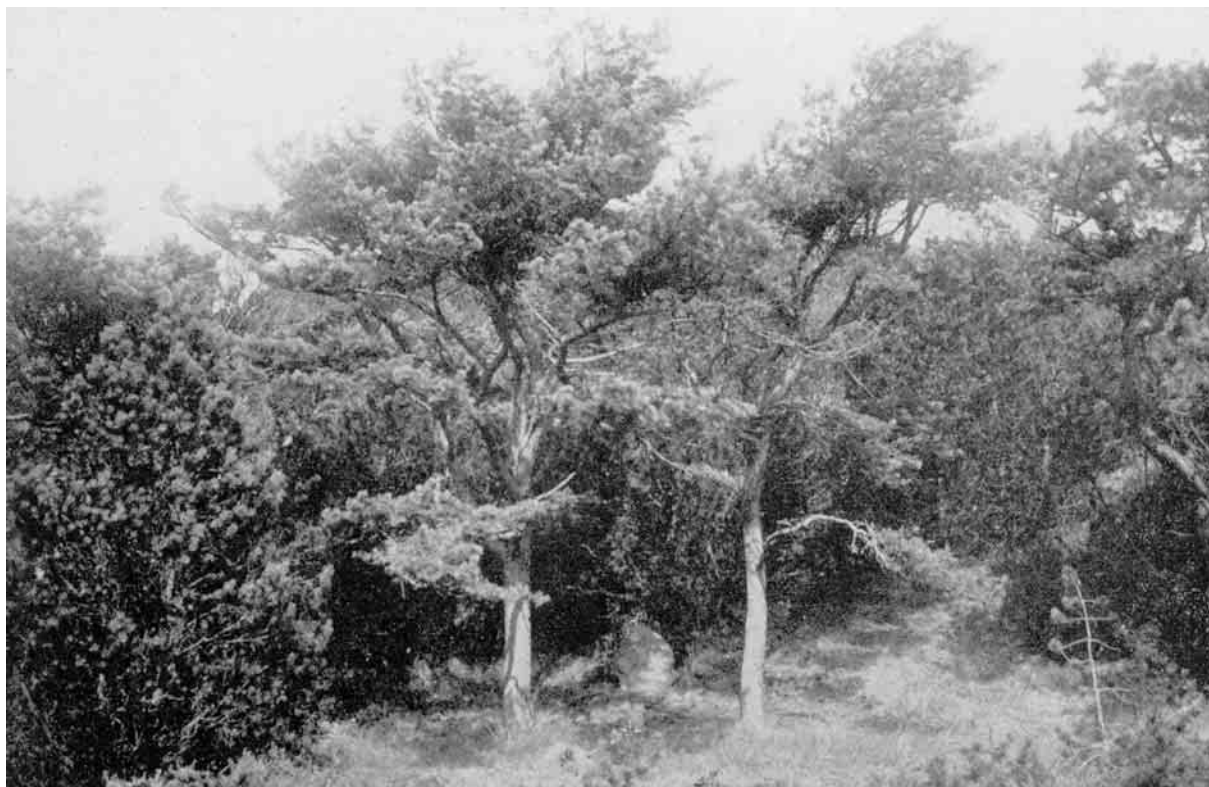
Rester af Kammerraad Andresens Planter i Hvidbjerg Sande.

kunne trives vel og bevare sin bindende Styrke. Sker dette ikke, sygner Klittaget, indtil Stormen en Dag faar Klitten til at briste, og Sandet paany hvirvles op og begynder at ryge. Da lever Klittaget op igen og tager til i Grøde, Bladene blaaner i Friskhed - og fortsætter Sandet at fyge jævnt og tæt, bølger Taget snart i Klitten som nogen Kornmark paa Bondens Ager.