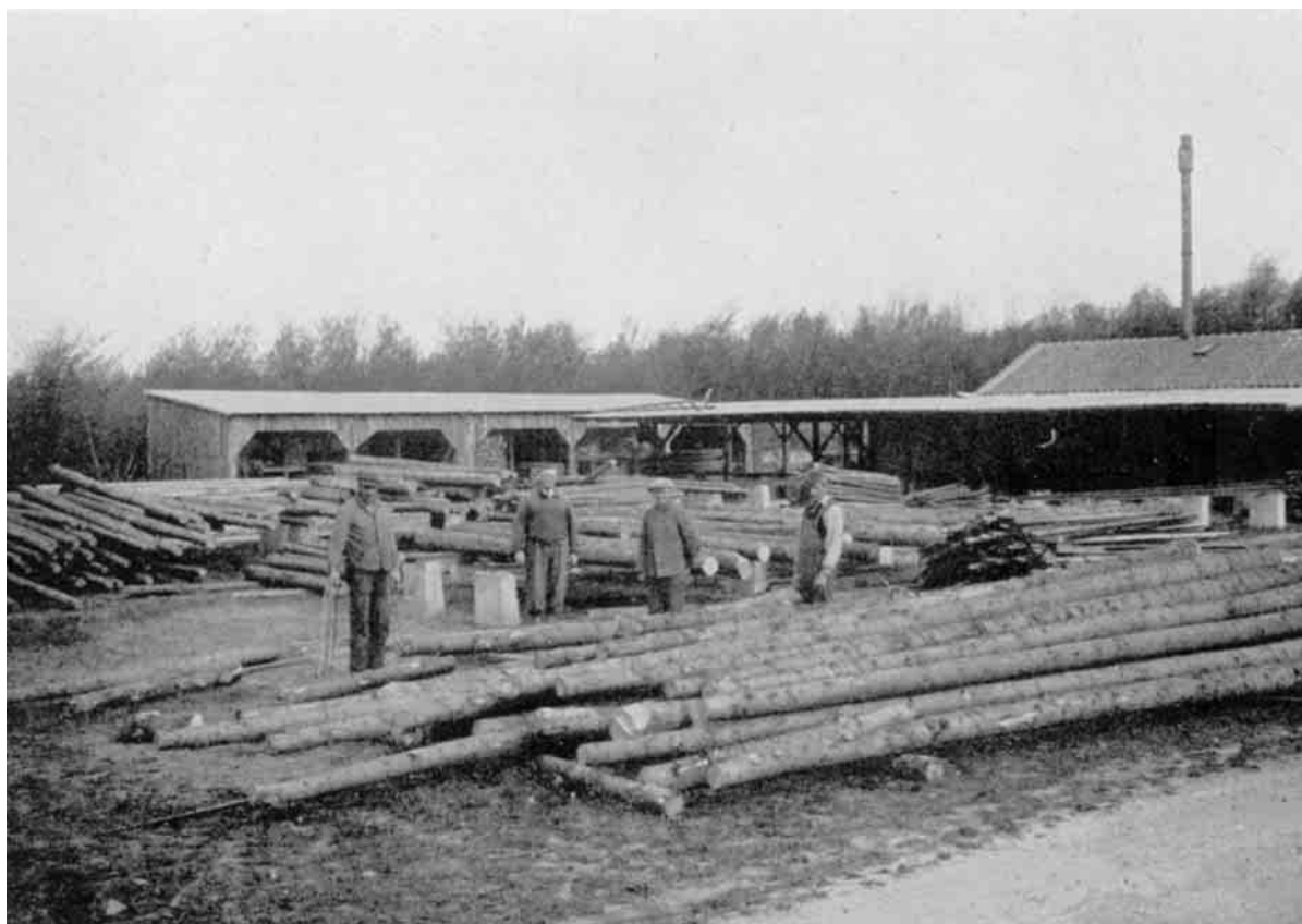
Søholt Savværk i Vilsbøl Plantage.

Men ogsaa paa dette Omraade søger Klittens Folk at raade Bod.