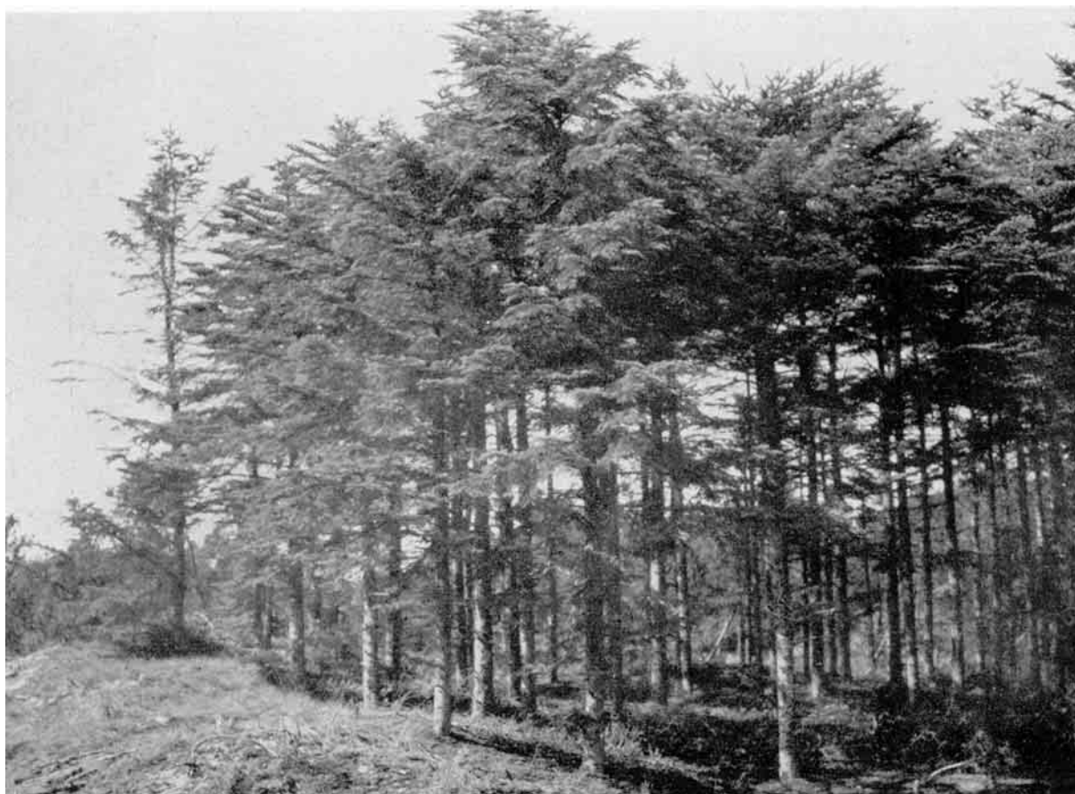
Ædelgran i Tvorup Klitplantage.

Fra Bulbjerg mod Amtsvejen mellem Thisted og Aalborg samt over Østerild Plantage til Klastrup og Norden om Hjardemaal By samt videre over Korsø til Viksø og i Retning mod Ballerum, ligger der et meget stort sammenhængende Hede- og Sletteland, som i Dag endnu kun delvis er i Statens Eje og beplantet. - Paa denne Strækning vil ad Aare Thylands største Skovland blive.