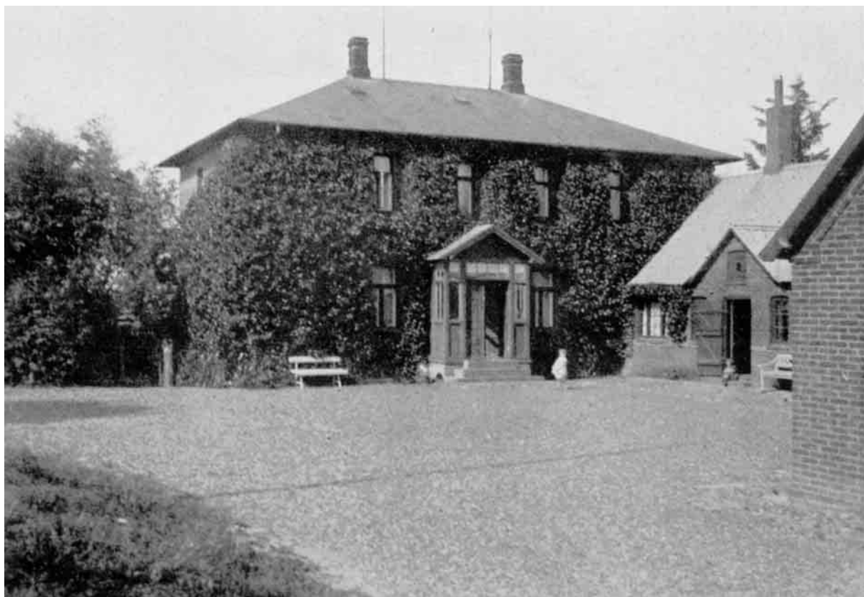
Over klitfogedboligen "Søholt" i Vilsbøl Plantage, hvor Bohn-Jespersen boede.

Forskydning i Retning af udpræget Lighed med de andre Institutioner - Statsskovenes Hedeplantning og Hedeselskabet - som stadig har søgt og søger at frembringe Skov paa Hede.