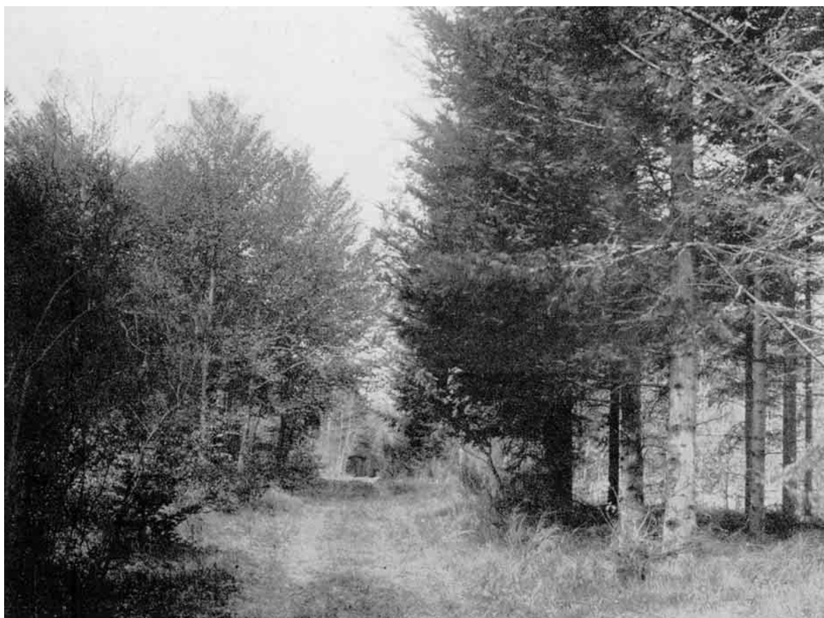
Bohn-Jespersens Forsøg i Vilsbøl Plantage.

Klitrose, Lyng, Mandstro, Svinemælk, Sandskæg, Sandstar, Muse-Vikke, Smalbladet Høgeurt, Kællingetand og - den yndigste af dem alle - den lille lyse og fine Stedmoderblomst.