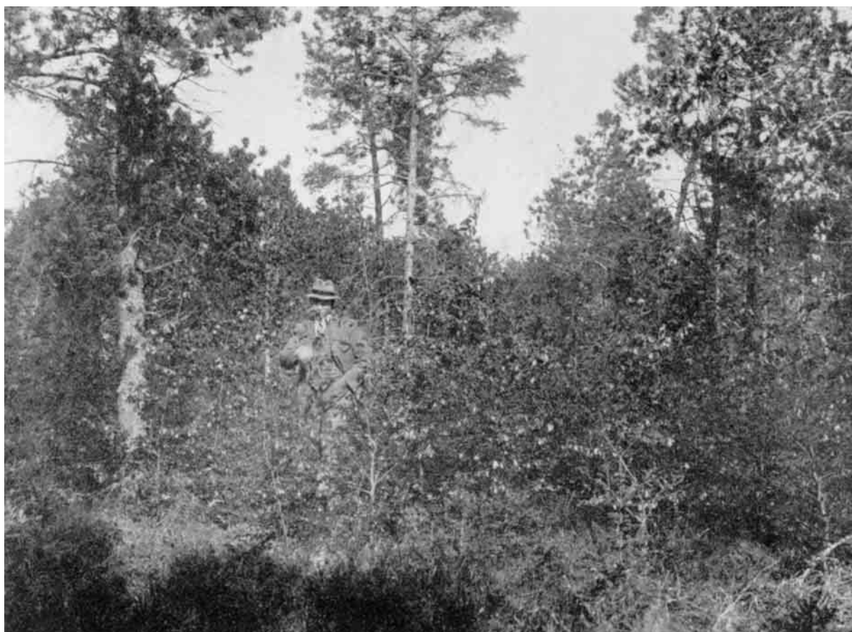
Bøgekultur i Østerild Plantage.

Mellem Vanned og Nors Søer ligger Vilsbøl Plantage med Bohn-Jespersens gamle Forsøg og mange unge Sitkagraskulturer. Her ligger ogsaa Klitvæsenets eneste Savværk i Thisted Amt - Søholt Savværk - der særlig under Krigen fik Betydning for Befolkningen i Thy, hvor den snart var ganske afskaaret fra at faa savskaaret Træ udefra.