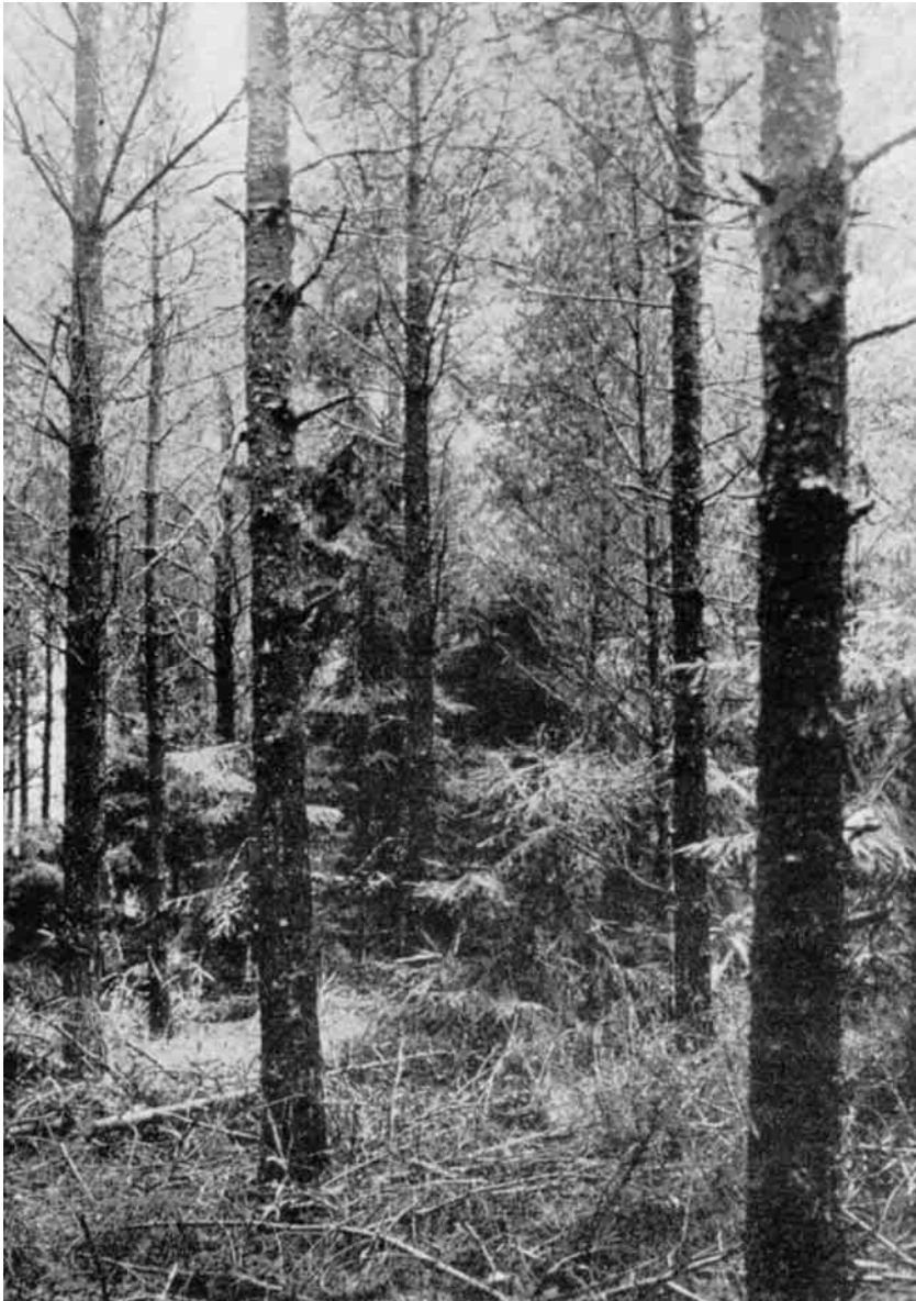
Skovfyr i Østerild Plantage.

Iøvrigt anbefalede Bjørnson Bjærgfyrren - og af Løvtræer Graaællen til Brug i Klitterne.