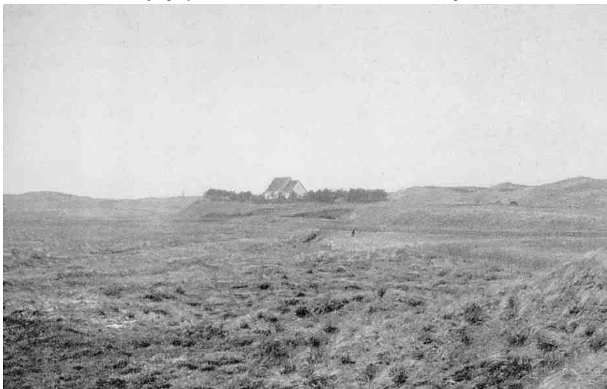
Omtrent ude ved Havet, paa alle Sider omgivet af udstrakte Klitarealer, møder man den lille og uanselige Lodbjerg Kirke, der staar som et Monument over henfarnes Slægters Kamp mod den vældige Naturmagt.

Tidligt trængte Sandet ind over Hvidbjerg Sogns nordlige Del, medens den sydlige Del var skærmet af Smaasøer og Egeskove. Men ogsaa disse Skanser faldt, og over en Mil naaede