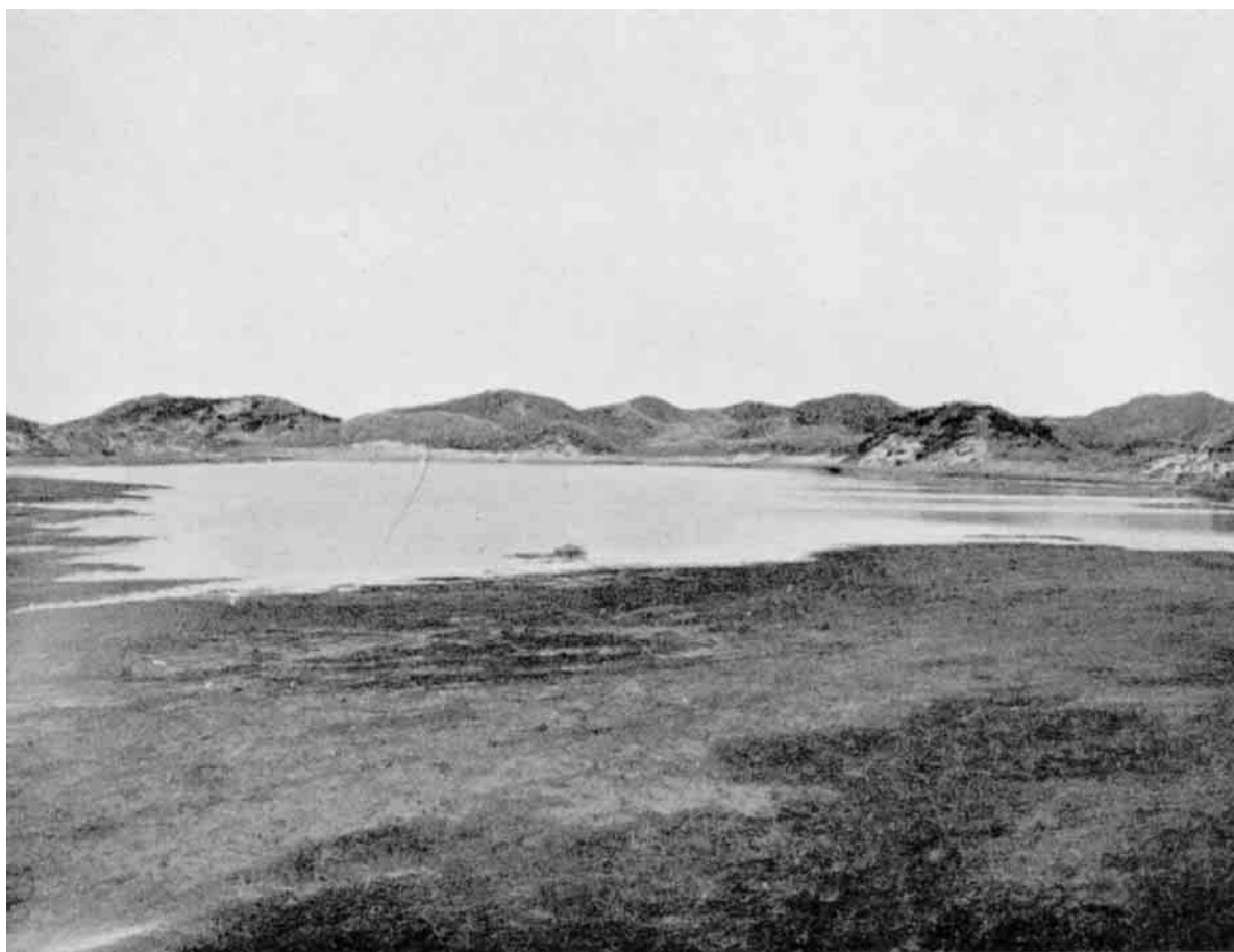
Godt skjult mellem høje Klitter finder man en af de smaa Søer, der virker behageligt afbrydende i et Landskab, hvor Sandet og Marehalmen er det dominerende.

Værre kunde det ikke gaa et helt folkerigt Sogn; nu var det helt ophørt at eksistere som Sogn betragtet, dets Kirke var borte, dets Byer og alle Gaarde forsvundet i Sandhavet. Nu begrænses Klitten af den halvt fyldte Vang Sø og den Lavning, der strækker sig ned mod Sjørring Sø, mod Nord naar Sandet overalt Sognets Grænser, og kun den østlige Del af Vang Sogn og et Hjørne af Tvorup Sogn er nu under Plov,