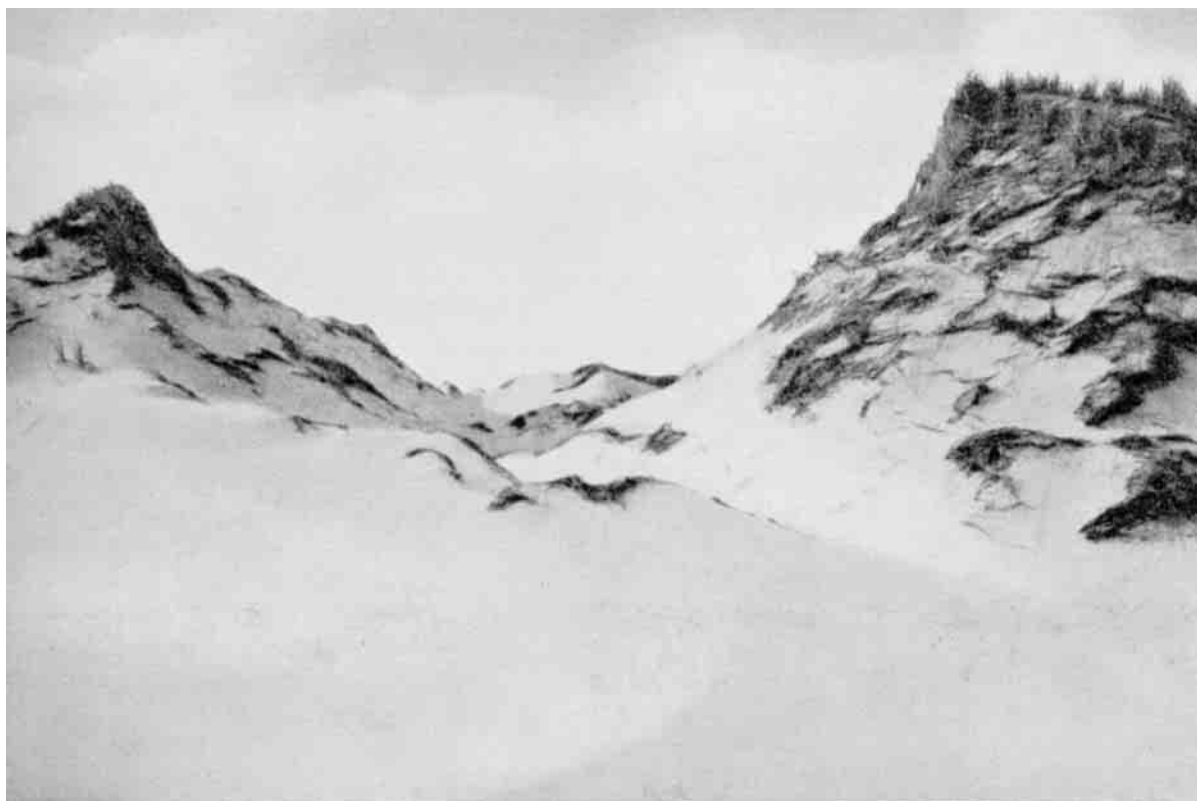
Paa en straalende Sommerdag kan en Sandklit som denne virke betagende. Men kom en Dag, hvor Vestenvinden farer over Landet og fører Milliarder af Sandkorn med sig – saa er Idyllen brudt.

Kongerne, der gennem Kancelliet havde modtaget Beretningerne om Ødelæggelserne, der ogsaa i høj Grad truede Kronens Indtægter, truede med strenge Straffe dem, der var hans Befalinger om Klitfredning og Skovhugst overhørig. Men alle kongelige Befalinger tiltrods, fortsatte Ødelæggelserne. Naar det var Østenvind harvede man de overblæste Agre for at faa Sandet til at blæse tilbage i Klitterne, men