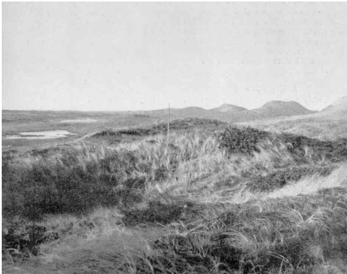
Vildt og forrevent fremtræder Klitlandskabet med de høje Sandbanker mod Havsiden. Bag disse finder man enkelte Engstrækninger, der kan give karrig Føde for en lille Faareflokk.

- Efter Sandet kom Havet. Allerede tidligere var der bortskyllet meget Land, og den 15.-16. Januar 1818 led Sognet stor Skade under en Orkan, der overskyllede Aggerboernes sidste