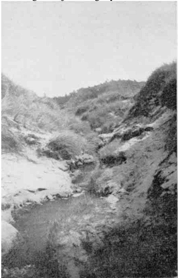
Bugtende sig ud og ind mellem vildt forrevne Klitter vandrer den lille Aa ved Bøgestedrende ud mod Vesterhavet – og lytter man efter dens stille Klukken, vil den berette om de Tider, da en stridende Strøm drev en Vandmølles Kværne og Pilleværk.

Dronning, der gravede Kanalen mellem England og Frankrig, og at det var denne Kanal, der var Skyld i Sandflugten. Muligt er det ogsaa, at den Naturkatastrofe, der sænkede det Stykke Land, hvor Kanalen nu ligger, har haft sin Betydning for Danmark, ved at den har forandret de Havstrømme, der berører de danske Kyster, men Sandflugten er jo af langt nyere Dato.