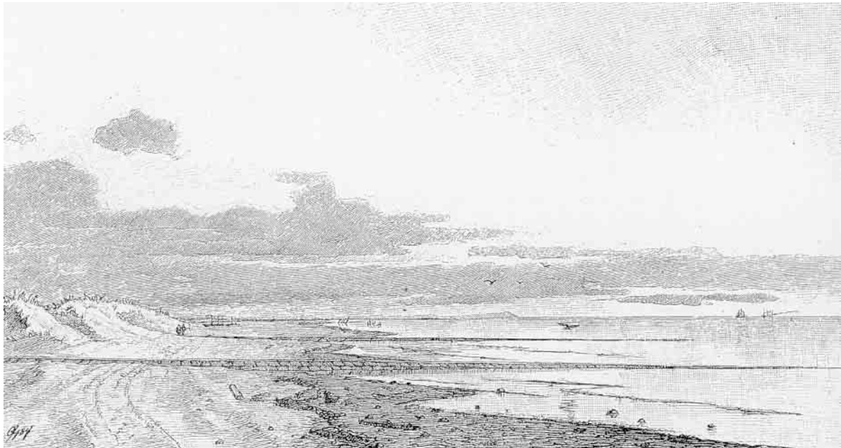
Efter et Par voldsomme Stormfloder i Begyndelsen af 1870erne, hvor Aggertangen truedes af fuldständig Udslettelse, tog man fat paa at sikre denne smalle Landstrimmel ved Høfdebygning – og allerede i Begyndelsen af Firserne var de første af disse Anlæg færdige. (Træsnit i Ill. Tidende)

Trediedele ødelagt, og Brøndum By, der havde 4 Gaarde og 1 Boel, var ligeledes paa det nærmeste ødelagt.