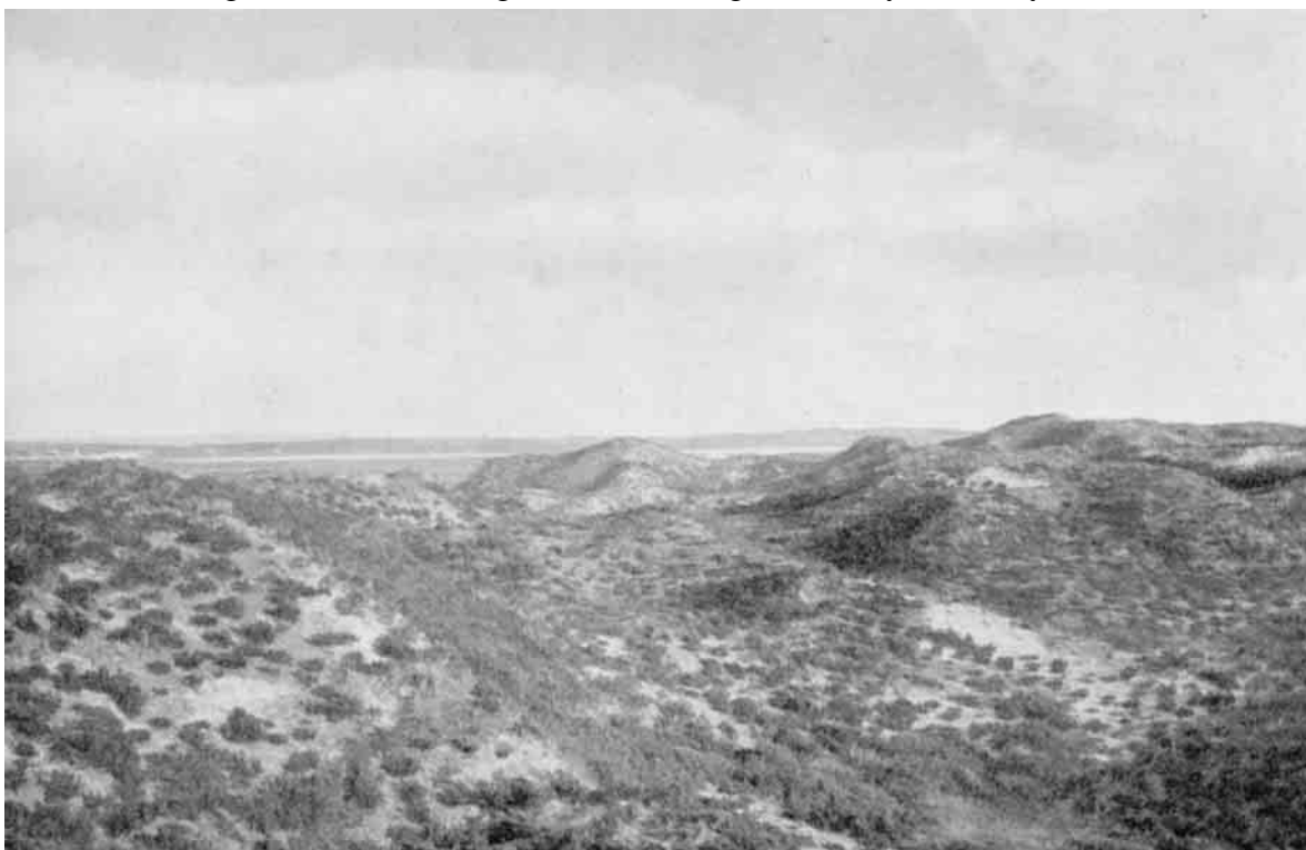
For den, der søger Fred og Stilhed i Naturen, vil en Vandring i Klitterne være det ideelle. Fra de højeste Klitter aabner sig ofte milevide Udsyn af betagende Virkning.

Og naar en ny Storm flyttede en Klit, kunde