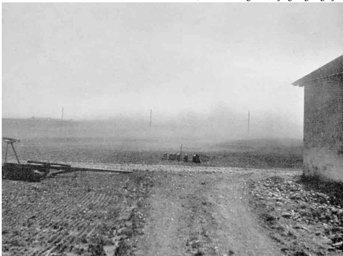
Sandflugten, der gennem Aarhundreder har hærget Landet mod Nordvest, kan endnu volde stor Skade og Ødelæggelse paa de dyrkede Marker, hvilket man faar et Indtryk af ved at se den "Sandknog", der her en Foraarsdag garr hen over den nyspirede Mark.

Hjardemaal Sogn var et af de Steder, hvor Flyvesandet først optraadte. Nord om Hanstholm, drev det ind over Stranden i Vigsø Bugt og lejrede sig først i store Klitter paa det flade Terræn Nord for Holmen, inden det af Nordvestenstormene ødelagde de store Strækninger, der her laa aaben, fri som de var for Trævækst og derfor en rigtig Tumbleplads for Flyvesand.