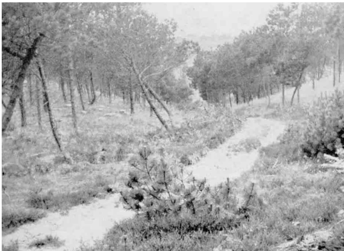
Vejlerne omkring Hannæs kunde ikke standse Sandflugten, der ogsaa har sat sine Spor paa den lille Halvø, hvor der paa det sandflugtshærgede Snekkerbjerg er anlagt en lille Plantage.

Sandflugten rasede dog vildt, og i 1690 er Annekspræstegaarden i Vigsø dækket af Klitter paa 20 Alens Højde, og i mange Aar kunde Sognets Gaarde knapt give Udsæden igen. I 1737 er der tilbage kun 7 Gaarde og 10 Boel.