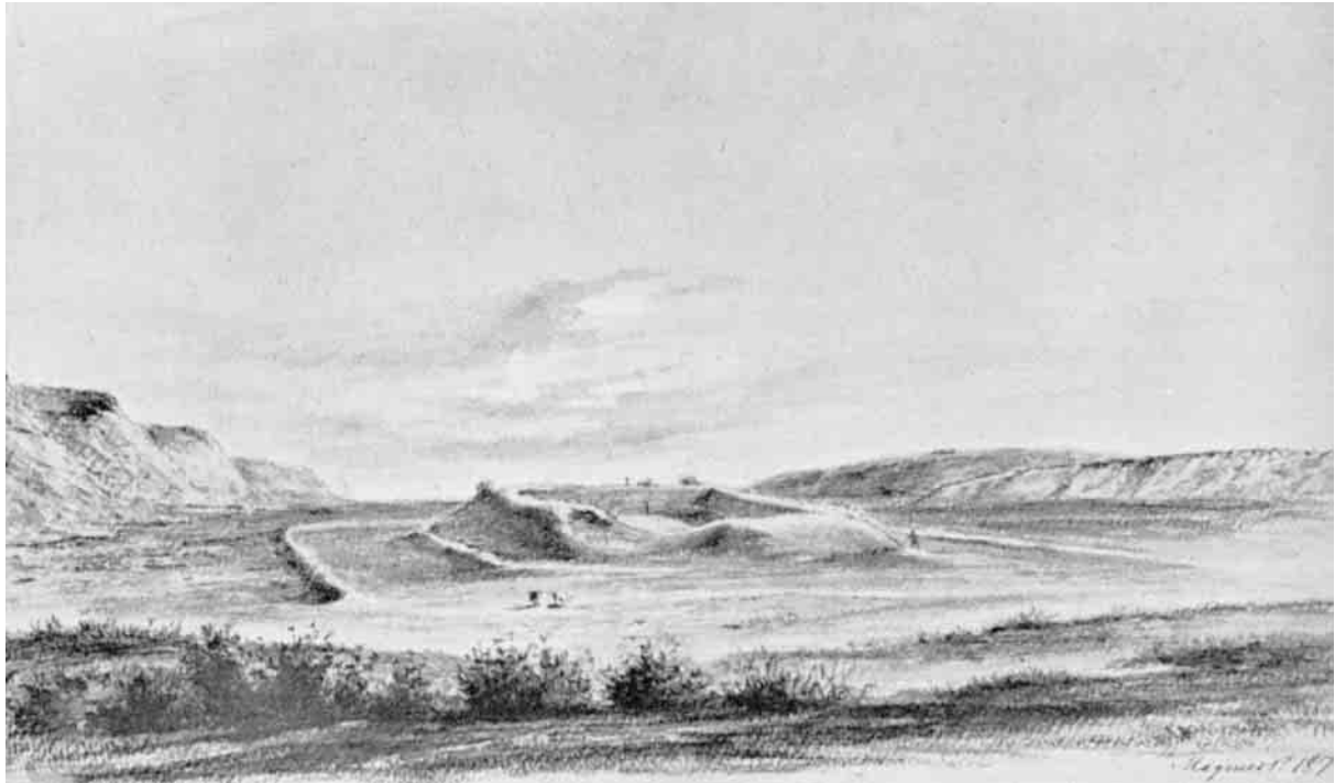
Paa Grænsen mellem Ræhr og Hanstholmen ligger Resterne af Voldstedet "Gammel Torp" – Gaarden, der en Tid var i Slægten Juels Eje, og hvor Søhelten Niels Juel tilbragte en Del af sine Barndomsaar.

gammel Hovedgaard og nævnes 1348; her har været et Voldsted, men ethvert Spor er