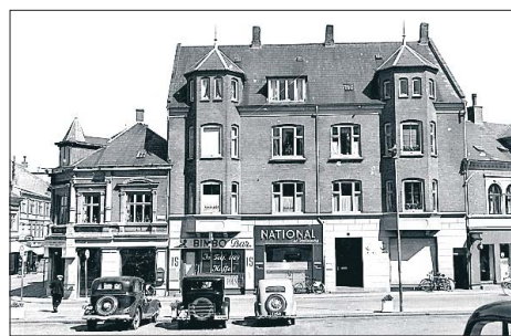
BILLEDET ER fra begyndelsen af 60'erne.

■ "Historien i billedet" er en rubrik, der med jævne mellemrum vil dukke op i Thisted Dagblad i håbet om, at det øger billed-bidragene til Lokalhistorisk Arkiv.