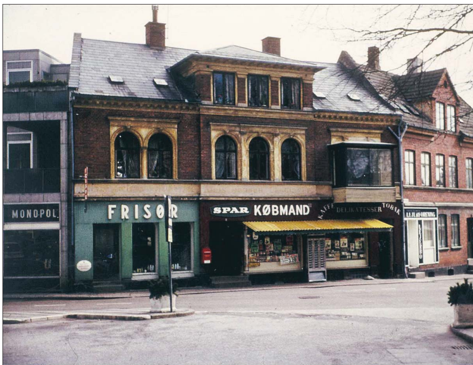
BILLEDET ER fra 70'erne.

Bimbo-navnet burde man i øvrigt også forske lidt i. Det har vist ikke den samme værlor i dag som dengang - eller hva? Men det er en anden historie.