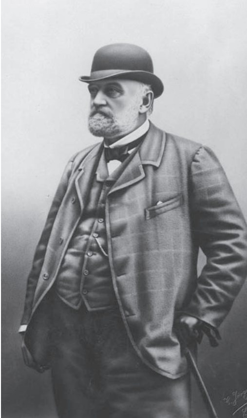
Enrico Mylius Dalgas.

samt holdt utallige foredrag rundt omkring i landet.