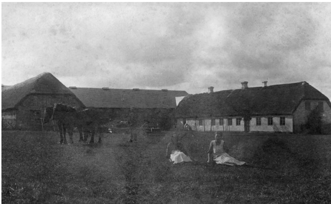
Kirkegård i Villerslev. Flyttet op fra kirken 1869 til Skyumvej 153. Sønderhuset bygget om i 1908. Gården brændte 3. februar 1927, men blev genopbygget samme år.