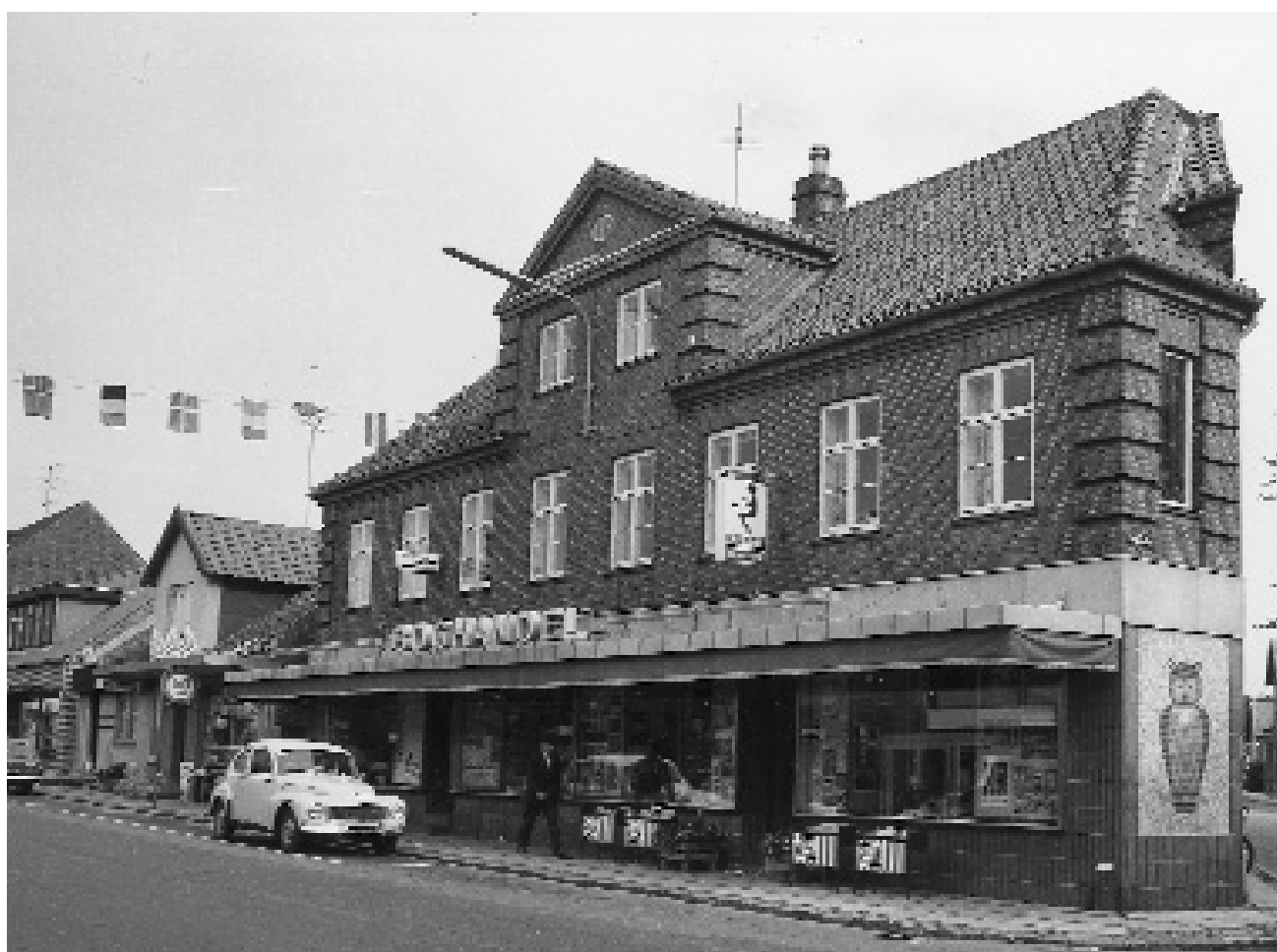
Foto fra ca. 1965. Bemærk den omfattende facade renovering - og uglen. Den er endnu ikke bortflojet.