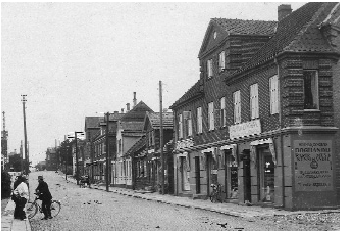
Foto fra 20'erne. Bredgade set mod vest. Bemærk hestepærer på gaden. Boghandelens gavlskilt fortæller, at man også handlede med rullegardiner.