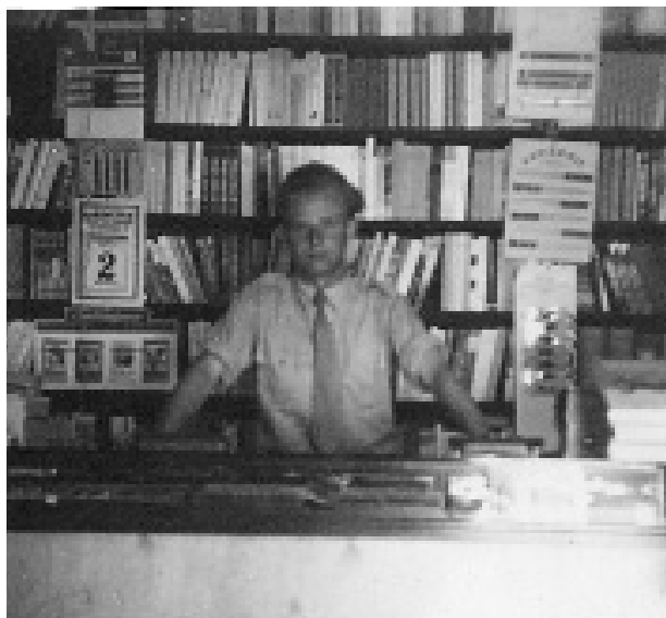
Forfatteren som elev 1954 med slips. Det kan nutidens elever vist ikke hamle op med! Det noget mutte udseende må skyldes, at der om sommeren var få kunder, inspirationen manglede.

Morsomme erindringer har jeg især fra den altid meget travle julehandel. Et år lancerede Texas Instruments en "omvendt" lommeregner under navnet "Den lille professor". Den kunne