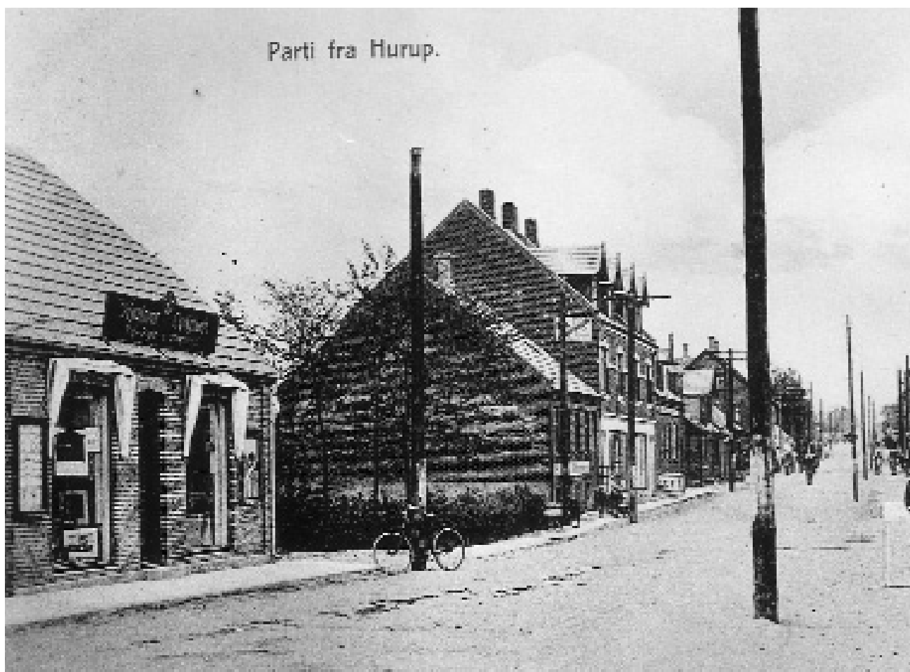
Bredgade ca. 1915. Bemærk at apoteket endnu ikke er blevet bygget.

Fra den omfattende "overbygning" af boghandlen 1920. Bemærk de arbejdende håndværkere. Det er datteren Minna, der står ved foden af den store stige. Det var åbenbart også det år, Bredgade blev brolagt.