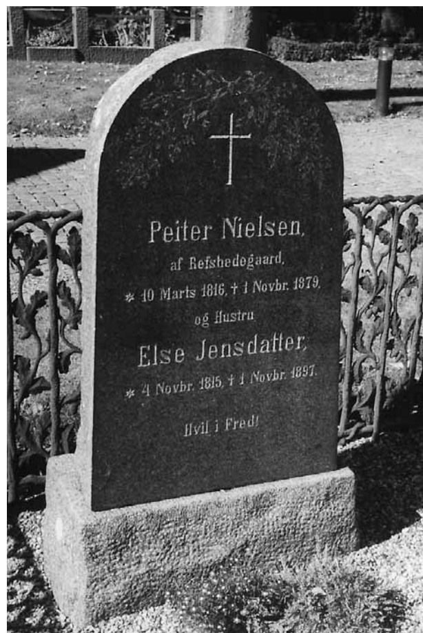
Gravsten på Ydby kirkegård.