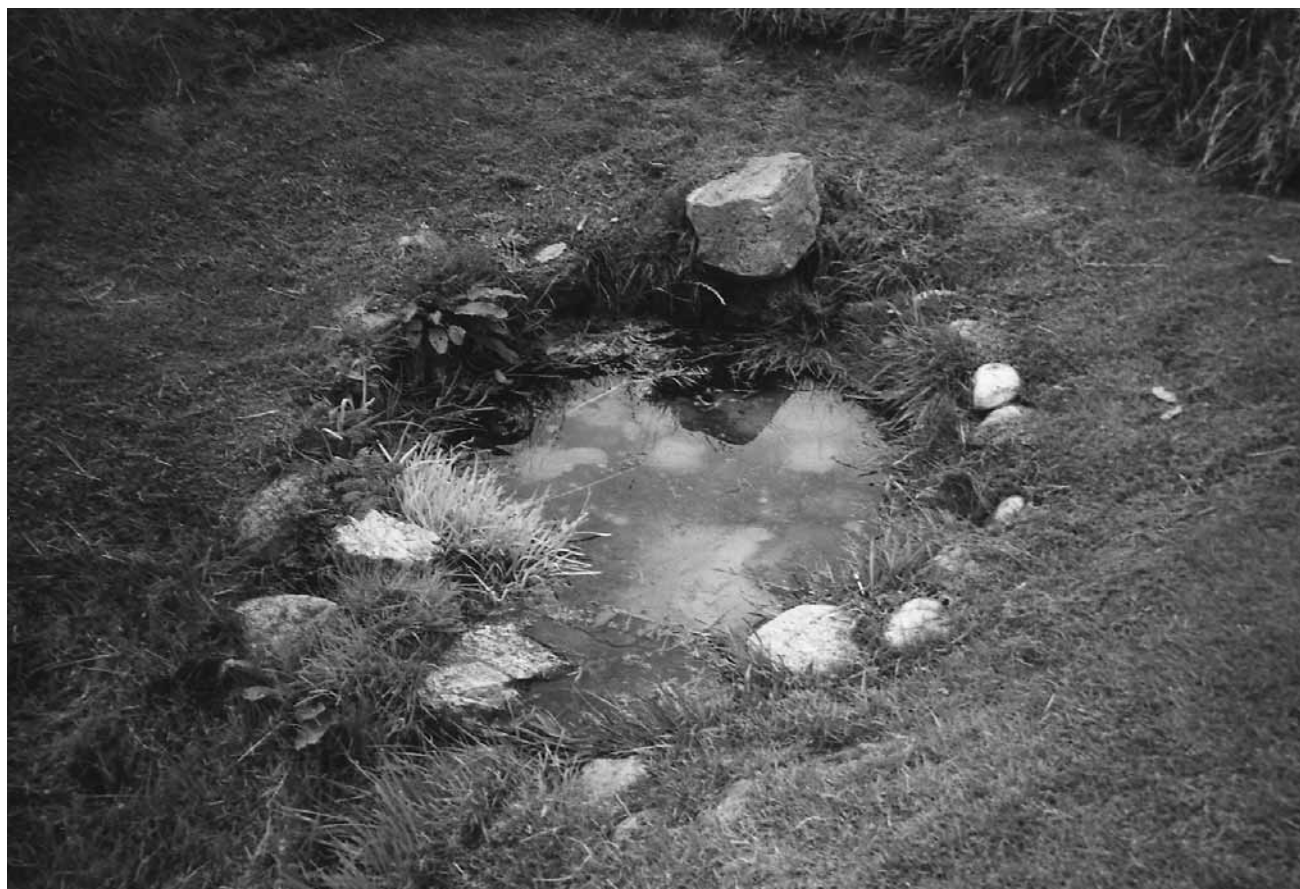
Helligkilden ved Helligkildegård.

I den forbindelse lige en lille sidebemærkning. Jeg har læst om - jeg ved ikke hvor mange kilder i Danmark - men jeg har, så vidt jeg