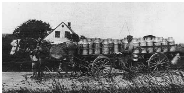
I nogle år kørte bedstefar mælkevogn - antagelig til Gettrup Mejeri.

Bedstemor har fortalt, hvordan hun hjalp ved forskellige fester og hvor hendes fine spi-