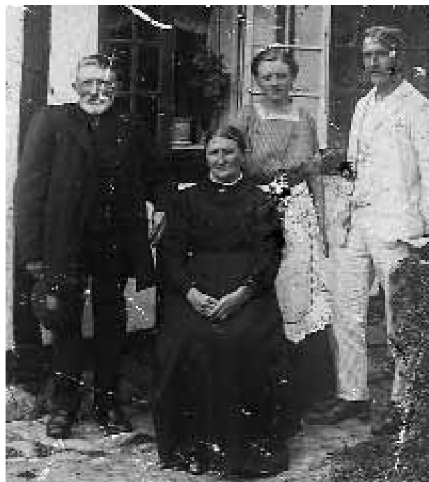
Gammelfar og gammelmor på Samsø 1911 sammen med en datter og en svigersøn.