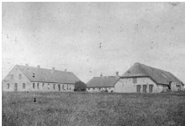
Fattiggården i Ullerup.

men). Blev der bundet til stak (når kornet skulle sættes i stak (hæs) skulle de skrå rodender af negene vende samme vej (når negene blev sat i »ræ« (hobe) skulle de stå på tå. Når marken var ryddet for neg blev æ ræ-ste af kvinderne revet ren med håndriver. Når møddingen var kørt på brakmarken var det pigernes bestilling at sprede møget, fårene blev vasket grundlovsdag og om efteråret, det besørgede karlen og pigen. Konen i huset klippede fårene. Når en karl blev fæstet gjaldt fæstemålet fra 1ste maj et år. Lønnen ca 150 kr. Der blev spurgt: »ær do gue te æ hylli ? ka do bær en tønd row? ka do pløw en lieg fujr? Også dengang hed det: Lige furer ser godt ud, de sparer tid, da der ingen ekstra vendinger bliver på agerens opløjning og de borger i høj grad for at hele marken er pløjet godt. En karl skulle kunne lægge tøjet rigtig på en hest, sad en bringsele for lavt blev hesten brudt, for højt drov den i kværk (kunne ikke få luft). Det var især når æ borer (græsmarken) blev dybpløjet, da måtte der holdes øje med hestene, begyndte én at slingre, skulle ploven øjeblikkelig væltes af jorden ellers gik hesten omkuld. Når så selen spændtes et hul ned sad den som den skulle.