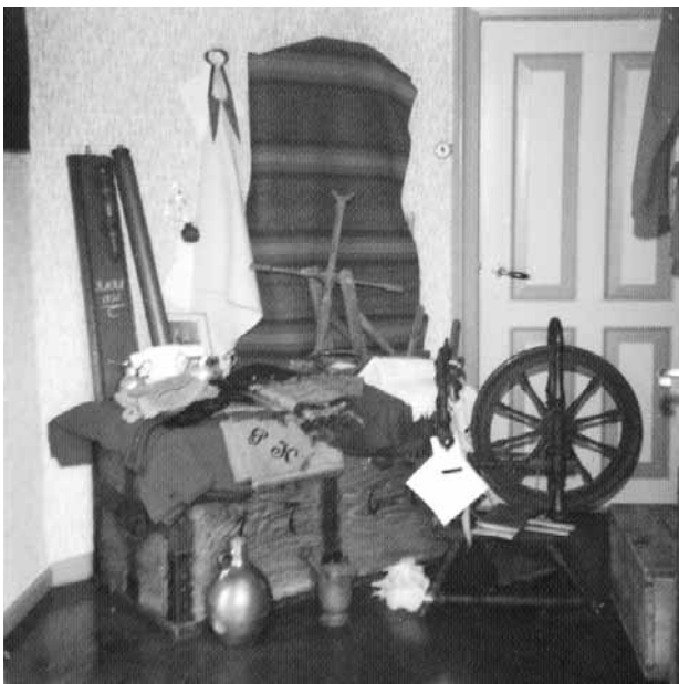
Spinde- og væveredskaber fra 1800-tallet.

På sund jord var der næsten aldrig hejre, men på lave fugtige pletter, var der næsten ene hejre. Når rugen var sået blev æ borer skrællet, der blev mønnet og kartoflerne taget op, så var det snart tid at gå i gang med efterårsplojningen, der skulle være afsluttet senest første november, så kunne karlen gå i laden og begynde tærskningen først rugen, det hed sig: rug på kamp, men byg på svamp. Der blev lagt 4 neg ud, når de var tærsket rene blev halmen lagt op i den ene ende af tærskeloen og rugen skubbet ind mod halmen. Det var lettest at tærske rugen på bar lo (på Kamp) sådan fortsattes der med