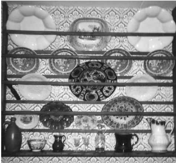
Tallerkenrække med keramik og porcelæn fra 1800-tallet.

dyr stod i tøj - kun hestene og køerne kom ind om natten. Når drengen var i marken havde han altid en skarp kniv i lommen, køllen på nakken, et bundt hæle og hælsom er på ryggen. Ramte en hæl (tøjrpæl) en sten måtte kniven rette på skaden, ramte han skævt med køllen, så flosning o koow blev slået i stykker måtte der en ny hæl til. - Fårene var de værste, - kom et par løs, løb de til et andet par og kom i »snæer«. Det er helt utroligt den knude, der kan knyttes i løbet af en nat, og for at løse sådan en bylt må der skæres en låen-strik. Løb fåret så fra ham var der ikke andet at gøre end »å oprend 'en« og det var en varm omgang. Han måtte passe på at fåret ikke fik så stort forspring, at det fik tid at lade vandet før han nåede frem for mens det stod på var det lettest at fange, men så var de som regel langt fra deres udgangspunkt og nu var dyret ikke til at få ud af stedet, slæbe eller bære det kunne han ikke (den var trasi). Den situation har kostet en bette fløt-dreng mange tårer. Ak, ja, den der har prøvet det véd besked. - Drengen jagede de med alle sammen, som Aakjær siger: »A hår rend djær møl-boj men di anner sow«. Mange ville have ham for nar, sende ham til naboen for at låne en møddingsskraber eller en træ-rækker eller:« Kender du plejlvisen?« Den måtte han lære - så satte de plejlen om halsen på ham og klemte til han skreg: av,av »Do kan jo æ plejl-viis, do mo osse