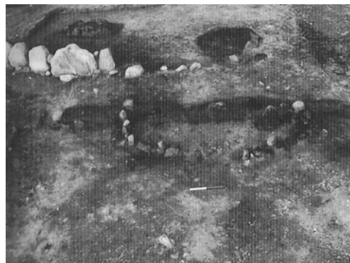
Aflukket tættere på. Bag huset og indenfor den yngre randstenskæde ses to af brandgravene, der er sat i forbindelse med huset.

Målestokken er 40 cm lang.