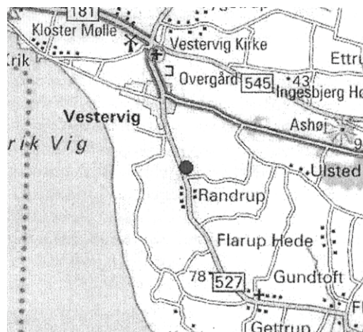
Grydehøj lå lidt syd for Vestervig på en bakke med vid udsigt over Vesterhavet.

Nu blev hele gravhøjen og et større område omkring den lagt fri. De centrale dele af gravhøjen viste sig at bestå af en lille, velbevaret randstenskæde anlagt for en grav fra enkeltgravstid. Randstenskæden havde en diameter på godt syv og en halv meter. Gravudstyret i centralgraven bestod af en stridsøkse. Denne velformede økse kunne datere graven til den mellemste del af enkeltgravstid,