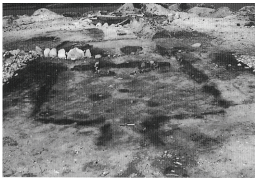
Huset næsten udgravet færdigt. Op til bagvæggen skimtes det halvcirkelformede aflukke.

Målestokken er 40 cm lang.