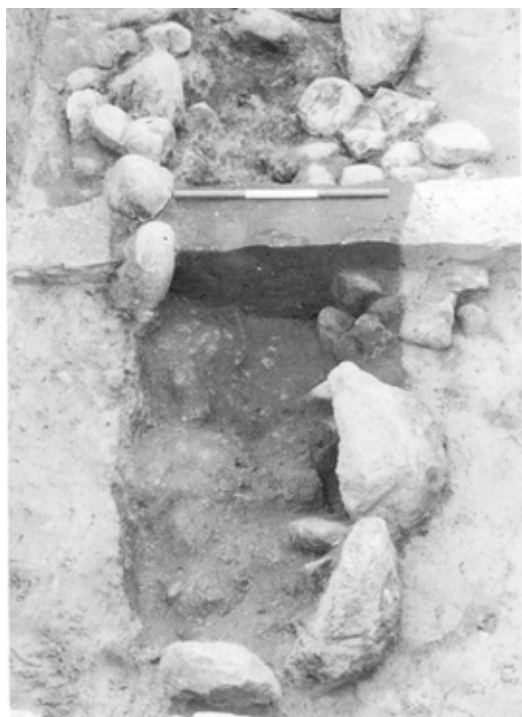
Den næsten 3 meter lange grav fra bondestenalderen under udgravning, set fra vest. Felterne på målestokken i billedets midte er hver 20 cm lange.