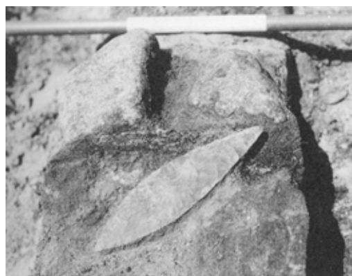
Den fine flintdolke på sin plads i graven.

mindst 1,80 m høj har han været, det vil sige mindst 5 cm højere end gennemsnittet på denne tid. Han lå udstrakt på ryggen med armene ned langs siden, og med hovedet hvilende på en sten i østenden. Der var ingen spor af kiste eller lignende, men over liget og de inderste sten i stenrammen var lagt et tyndt lag gulbrunt ler, inden graven blev tildækket. Formentlig har han været gravlagt i sit tøj, evt. pakket yderligere ind i et skind eller lignende.