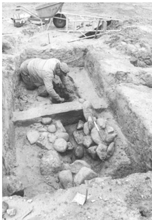
Der arbejdes med tømming af stenaldergraven.