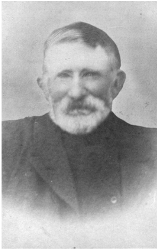
Gammelfar som 70 årig. Det eneste billede som findes af ham