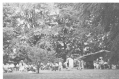
Haven ved den gamle plantarbolig var en dejlig ramme om festen.