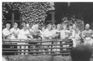
Svankjær Koret i udfoldelse