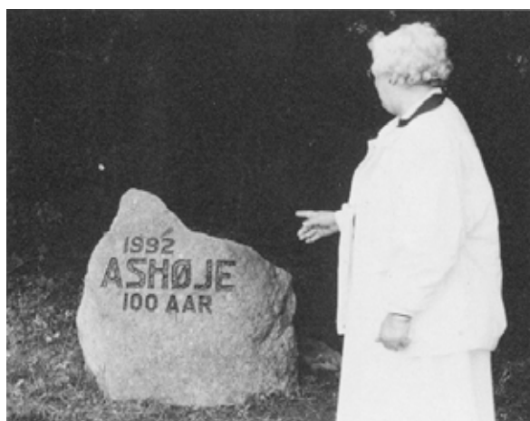
Elly Mardal afslører mindestenen på Ashøje Plantage.