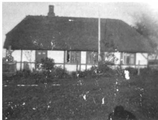
Formentlig »Krogens stuehus for 1882

Det ses heraf, at gården havde en trediedel af sit dyrkede areal i Krogfald og resten fordelt i 7 andre marker ("fald"). Krogfald bestod af ialt 26 agre, hvoraf denne gård alene rådede over halvdelen. Her har vi sikkert forklaringen på gårdens navn "Krogen". Desværre er marknavnet Krogfald ikke anført på udskiftningskortet fra 1793, og ingen nulevende, som jeg har kontaktet, har hørt om en lokalitet af dette navn.