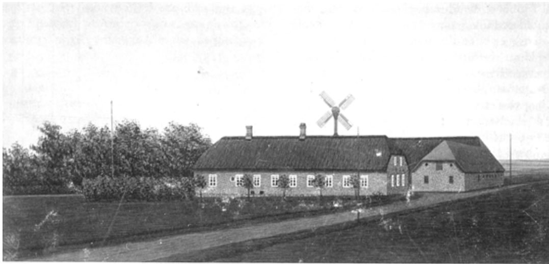
»Vester Fuglebæks, ca. 1910