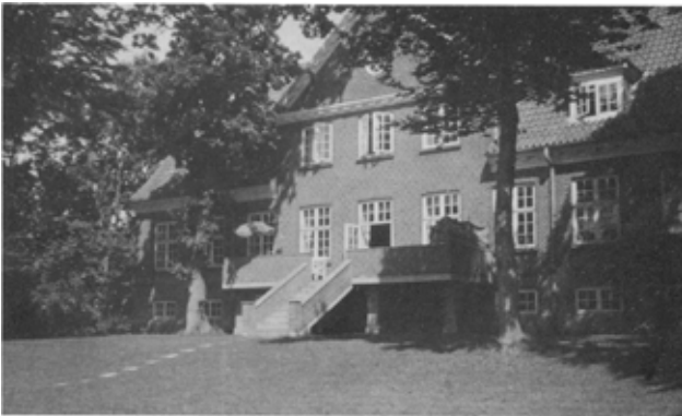
Det nye stablebyggeri i 1920.