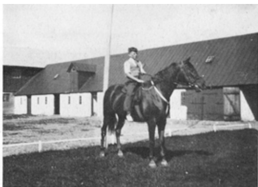
Østlængen bag hesten rummede bilgarage, folkeværelser og bestestald.

stalden i vinterhalvåret. Om sommeren gik køer og ungkreaturer ude, så i denne del af året var arbejdet væsentligt lettere. Hvornår vi fik malkemaskine, kan jeg ikke med sikkerhed sige, men det har nok været i begyndelsen af trediverne. I nogle år blev malkekvæget, som var en Jersey-besætning, kørt til Vildmosen i sommermånederne. Fodermesterfamilien flyttede med, de havde hest og vogn med og kørte hver dag mælken til Tylstrup mejeri. For os børn var det en hel udflugt, når vi med madkurv drog til Vildmosen for at se til kvæget, vi kom dog som regel hjem igen samme dag hvis vi ikke skulle besøge familie i Vendsyssel. For fodermesterfamilien var det ikke en 3 mdr. sommerferie, de skulle jo her oppe nordpå malke med håndkraft, og ensomheden i den nyopdyrkede Vildmose kunne nok også somme tider være en belastning.