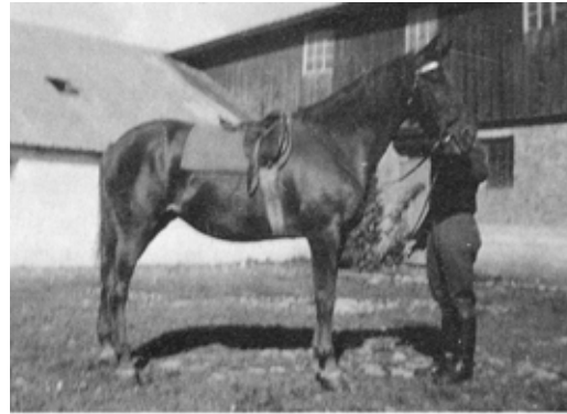
Min mors ridehest. Bygningen i baggrunden er til venstre kostald, til højre lade bygget omkring 1930.

Jeg vil med denne artikel prøve at beskrive livet på en gård i gamle dage.