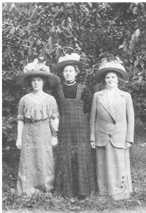
Pigerne var da også søde dengang!

I almindelighed havde vi to høstmænd og to opbindere foruden gårdens faste mandskab gennem hele høstperioden. Det tog jo tid at få kornet høstet. Samtidig skulle det sættes sammen og inden indkørslen bindes i toneg - de enkelte