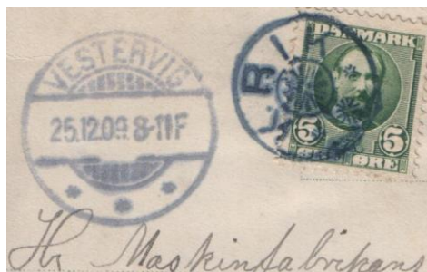
Tidlig brug af stjernestemplet.