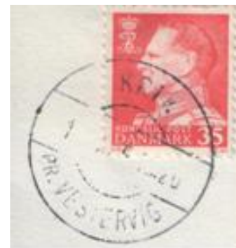
Pr. stemplet er tildelt i 1950.