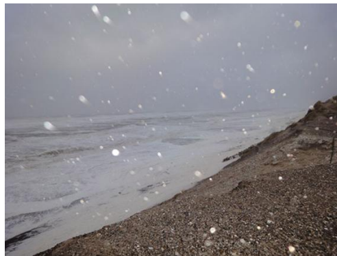
Skummet flyver ved Lyngby

Meget af det er vel smidt overbord fra skibene, tomme, rustne oliedunke, sandslidte flasker, hvis ufortoldede indhold har været brygget i Skotland eller presset ud af Frankrigs druer, er blandt de genstande, man hyppigst træffer på. Men også broderlandene har givet deres bidrag, planker, vokset i Sveriges skove skyller herind. Her står en kasse der har indeholdt kondenseret mælk, ”Viking Melk”, Oslo, står der på den. Det er nordmandens lyst til at prale med vikingnavnet, der viser sig igen. Jeg har ellers aldrig troet, at det