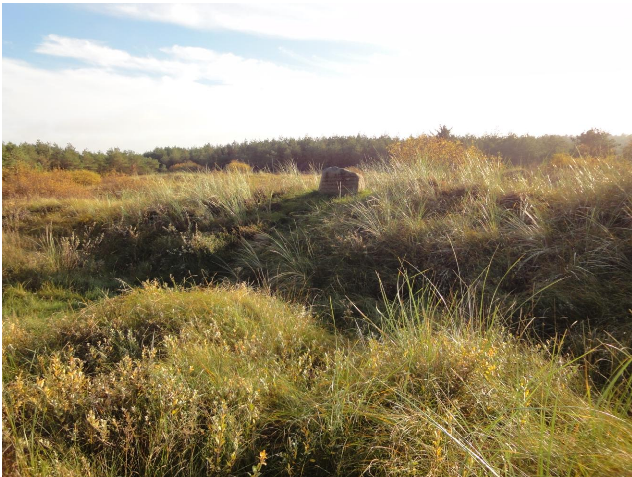
Gl. Kirkegårds Mose området

Vi prøver at finde dem frem over hele arealet, men det er ugørligt, mægtige klitter har her og der brudt ind og dækket højene, men i en gruppe ligger der en halv snes, og enkelte ligger de helt ud til den yderste klitrække. Et andet sted finder vi tre mægtige langhøje, 7-9 meter i højden, med et mægtigt omfang ligger de dystert og halvt truende og får os til at tænke på bogen om Kong Salomons Miner.