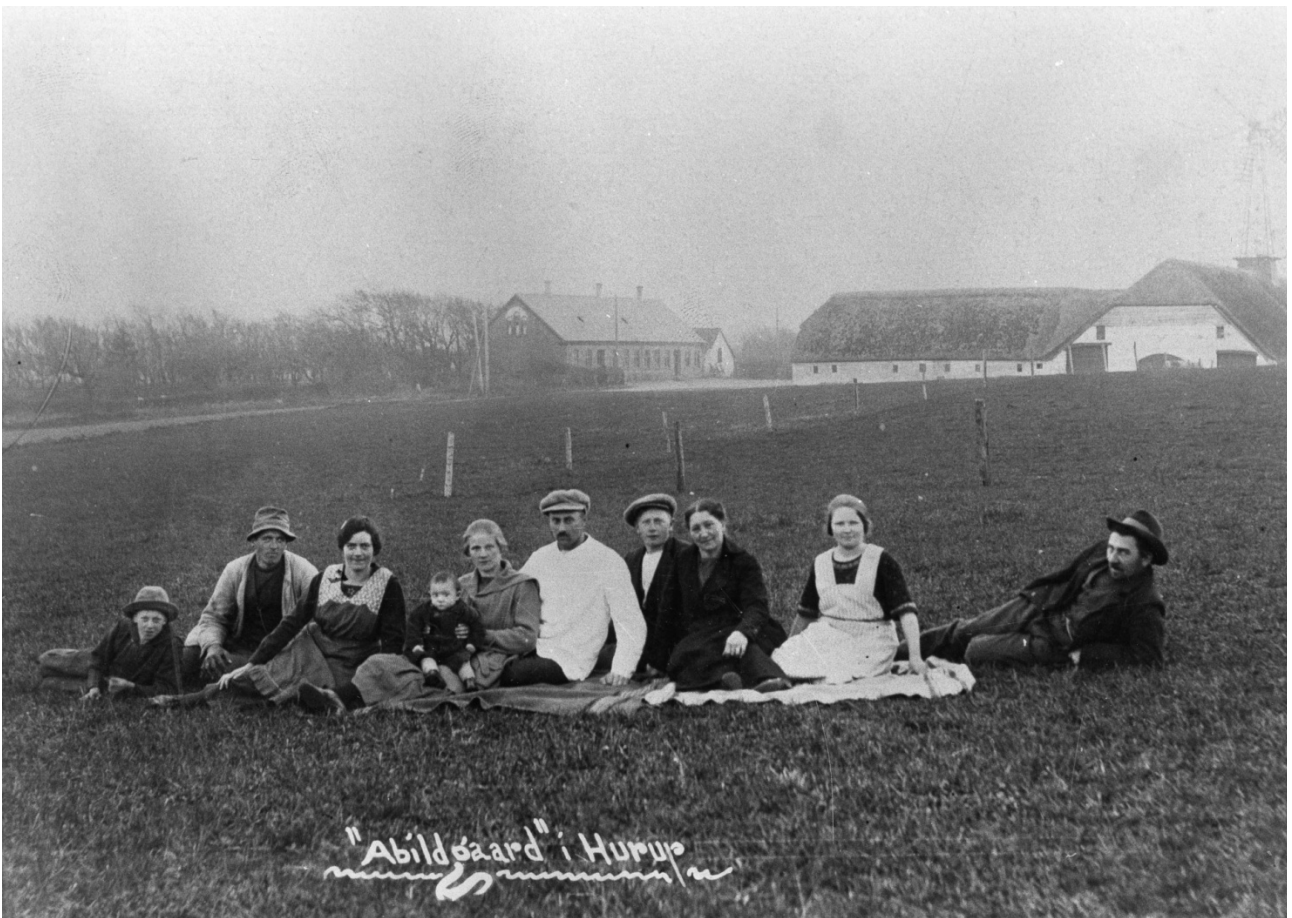
Folkeholdet på Abildgaard, Grurup ca. 1904.

”Abildgaard” i Grurup sogn er en meget gammel gård, hvis første historie er dunkel og glemt. Som mange andre gårde har den haft en højst omskiftelig tilværelse, først en udflyttergård, beboet af fribønder, siden en adelig sædegård for senere som så mange af dens samtidige større gårde, at ende under Vestervig Kloster, indtil reformationen gjorde en brat ende på gejstlighedens jordhunger, og Staten igen solgte dens gårde og gods til private.