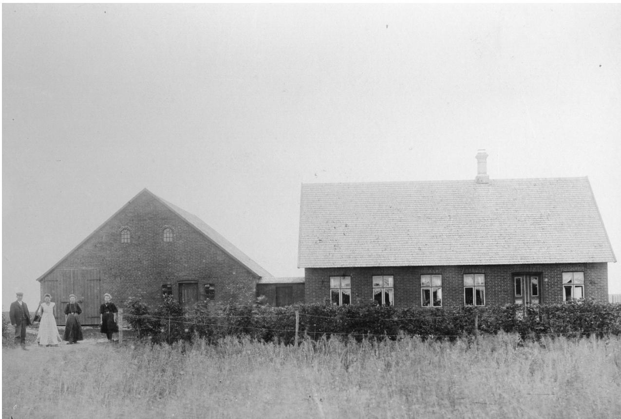
Den første ejendom, som blev udstykket fra Abildgaard, 1904.