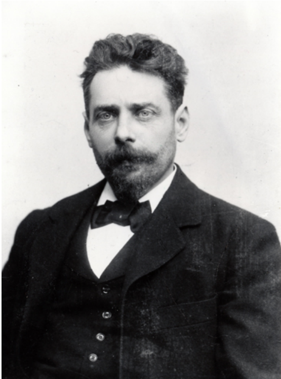
Digteren Henrik Pontoppidan (1857-1943) - nært forhold til Thy.