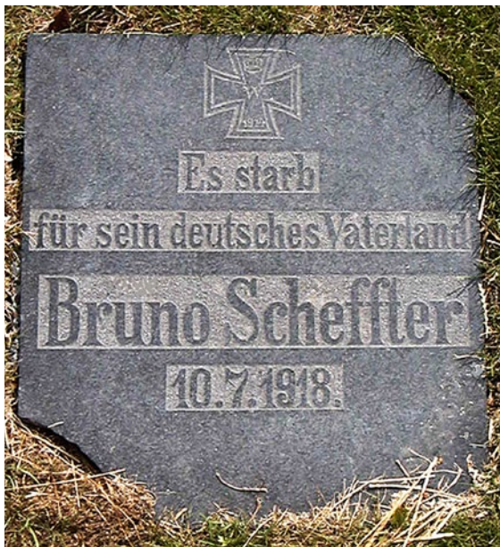
Gravstenen på Helligsø kirkegård.