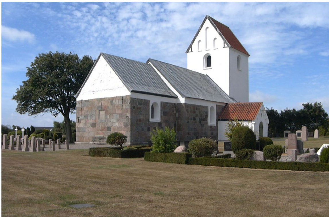
Helligsø Kirke. Graven ses i græsset forrest til venstre.

På Helligsø kirkegårds østlige side ligger en grav helt for sig selv, langt fra andre grave. På den sorte gravsten står der: »Es starb für sein deutsches Vater-