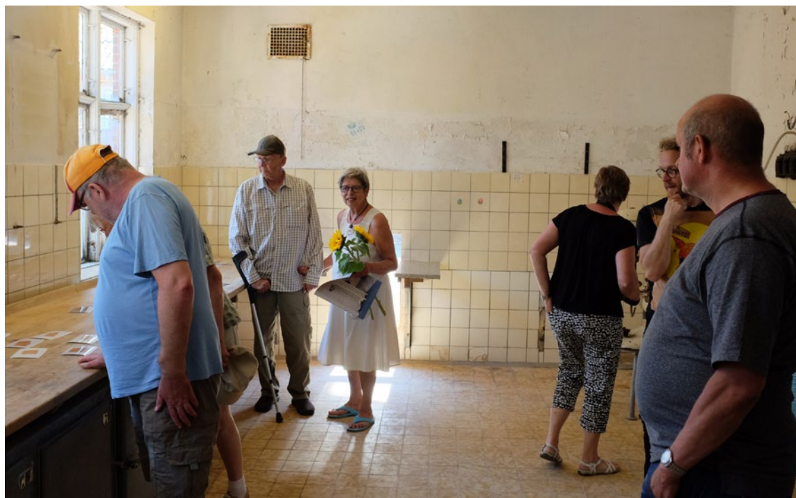
Bageriet ved åbningen den 4. juni 2016.

Idéen om at omdanne én eller flere forladte bygninger i Thy til en teaterinstallation opstod allerede i sommeren 2011 som et samarbejde mellem Arkitektskolen Aarhus, Teater Nordkraft og Thisted Kommune, men projektet var afhængigt af ekstern støtte og ikke mindst udfordret af at finde flere egnede bygninger med betydning for mange mennesker. I øvrigt bygninger med så centrale placeringer, at det ville kunne sikre lokal respons i et omfang, så en egentlig udveksling af fortællinger kunne finde sted. Den fornødne støtte blev modtaget fra Kulturaftale Nordjylland, Statens Kunstfond og Spar Nord Fonden.