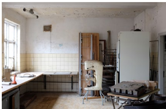
Bageriet før teaterinstallationen.

rer væksten, mens yderområderne forgæves forsøger at hænge på.