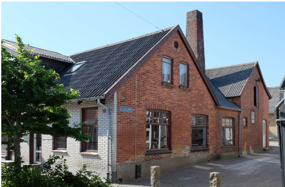
Konditoriet set fra gågaden mod Bryggerivej.

Affolkningsproblematikken forstærkes yderligere af at landbefolkningens gennemsnitalder stiger, da det især er de yngre generationer, som søger byernes uddannelsesmuligheder. Resultatet er slående, hvad angår værdien af fast ejendom, idet byernes tårnhøje og hastigt stigende huspriser i den grad modsvares af forladte bygninger uden markedsværdi i landdistrikterne. Et truende scenarie er et socialt skævvredet Danmark, hvor de største byer præste-