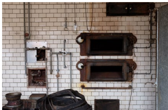
Den massive ovnkerne.

Det tomme konditori på gågaden i Hurup udgør netop én af disse bygninger og indskrives sig som én af flere prototyper i et forskningsprojekt ved Arkitektskolen Aarhus i samarbejde med Thisted