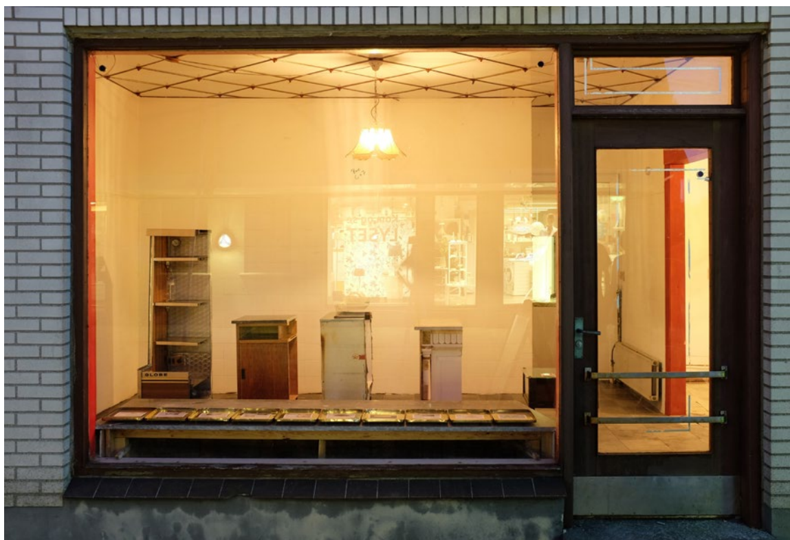
Det »genåbnede« bageriudsalg på gågaden i sin genetablerede døgnrytme. Opskârne diske fra forskellige perioder har genindtaget butikslokalet.

Den 4. juni 2016 genåbnede konditoriet. Inden da var adskillige tidligere ansatte, slægtninge til de tidligere beboere og kunder blevet interviewet og indgik i installationen med fragmenter af deres fortællinger, afspillet på de relevante steder og understøttet af et komponeret lydspor med lyde optaget i bygningen. Konditoriet havde således genvundet sin døgnrytme, affødt af lyd som nærværende stemmer eller i maskinel form. En cyklus, som blev tydeliggjort ved lydsporets samspil med en designet og timet lyssætning. Endvidere søgte installationen at indgå i Hurrups handelsliv ved at holde åbent samtidig med butikkerne i gågaden.