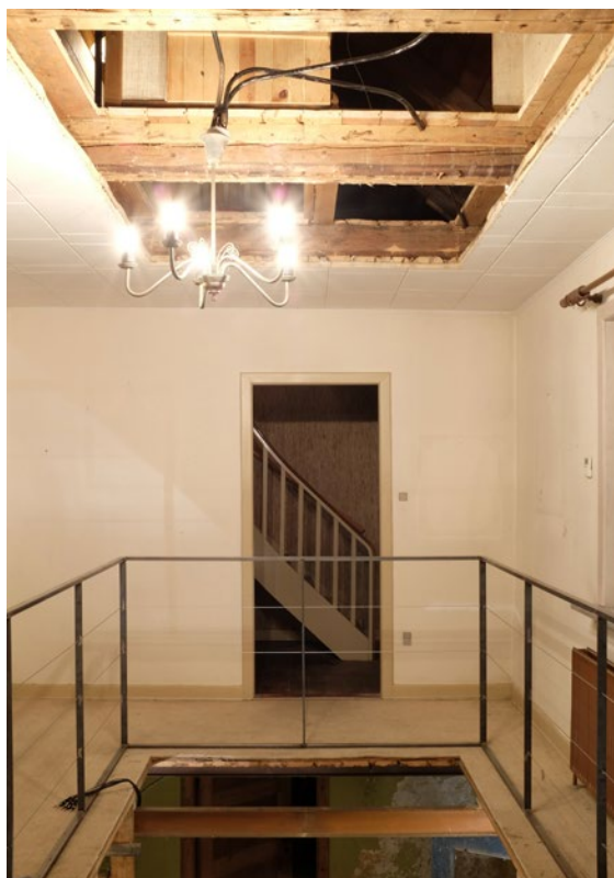
Et snit gennem alle etager, som en iscenesat arkæologisk udgravning.

Teaterinstallationen søger at bidrage med et nyt kritisk perspektiv på forladte bygninger og det, som potentielt tabes, når disse nedrives uden tøven. Ironisk nok viser det sig, at nedrivningen som metode viser et slægtskab med den brutale historieafdækning, der udspringer af de anvendte bygningsgennemskæringer. Tilbage står spørgsmålet, om de massive nedrivningsindsatser – for få midler – i mange tilfælde vil kunne omdirigeres til at virke bevarende