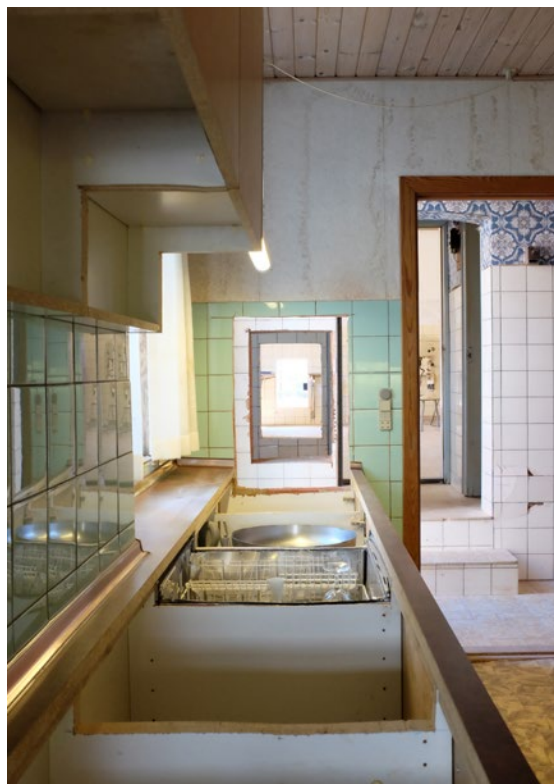
Den genetablerede rumlige forbindelse fra butik i gågaden gennem bolig til bageriet.

I teaterinstallationen i Hurup tjente de tre snitrelaterede indgreb til at pirre nysgerrigheden for derefter at fremprovokere latente erindringer hos de besøgende, hvilket disse indgreb var i stand til, da de hver især repræsenterede forskellige æraer i bygningens levetid. Erindringer fra forskellige perioder,