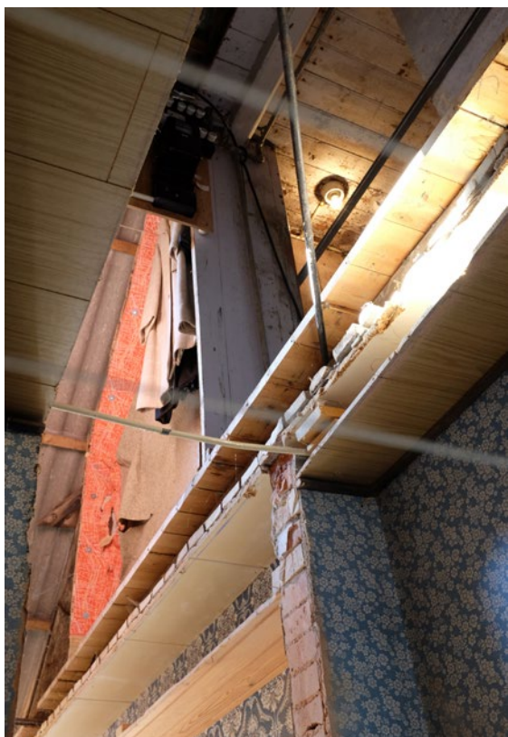
Bygningens historie som lag afdækket ved gennemskæring.

Den fjerne kontekst blev inddraget ved at døre, senge og andet inventar fra konditoriet blev installeret i Teater Nordkrafts sal i Aalborg. Her blev de ophængt i deres oprindelige indbyrdes positioner, lys- og lydsat så de kunne udspænde konditoriets rumligheder som en spejling af installationen i Hurup. En spejling skabt af netop det inventar, som var fraværende i Hurup, og som videre blev en spejling af land og by, da installationen i Aalborg, som et hint til affolkningsproblematikken, blev plantet som en trojansk hest i hjertet af en større by.