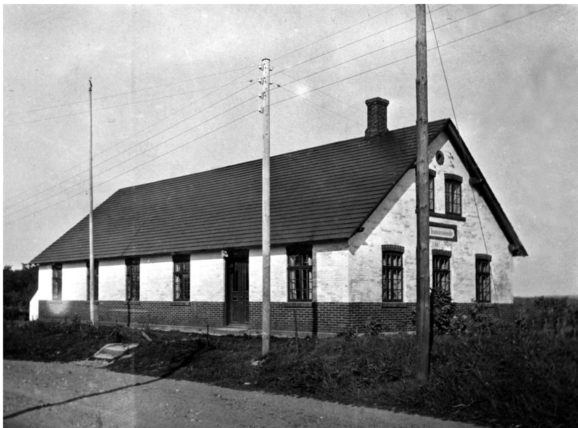
Sennels Forsamlingshus, ca. 1920.