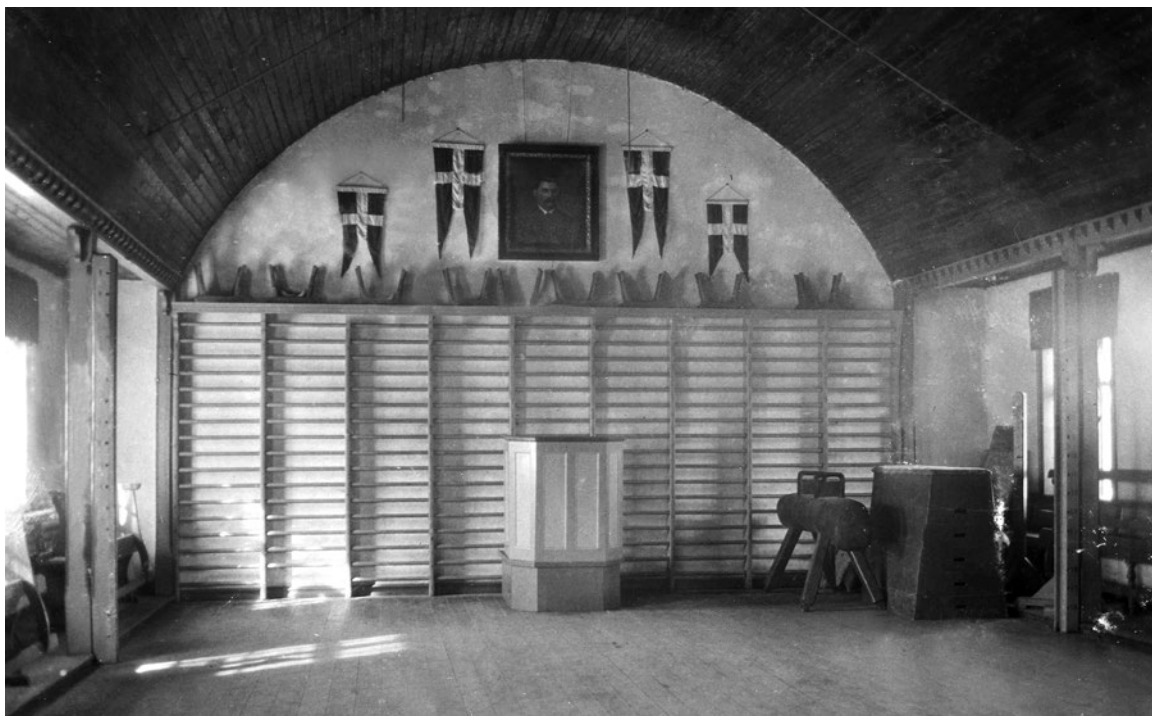
Den store sal, ca. 1920.