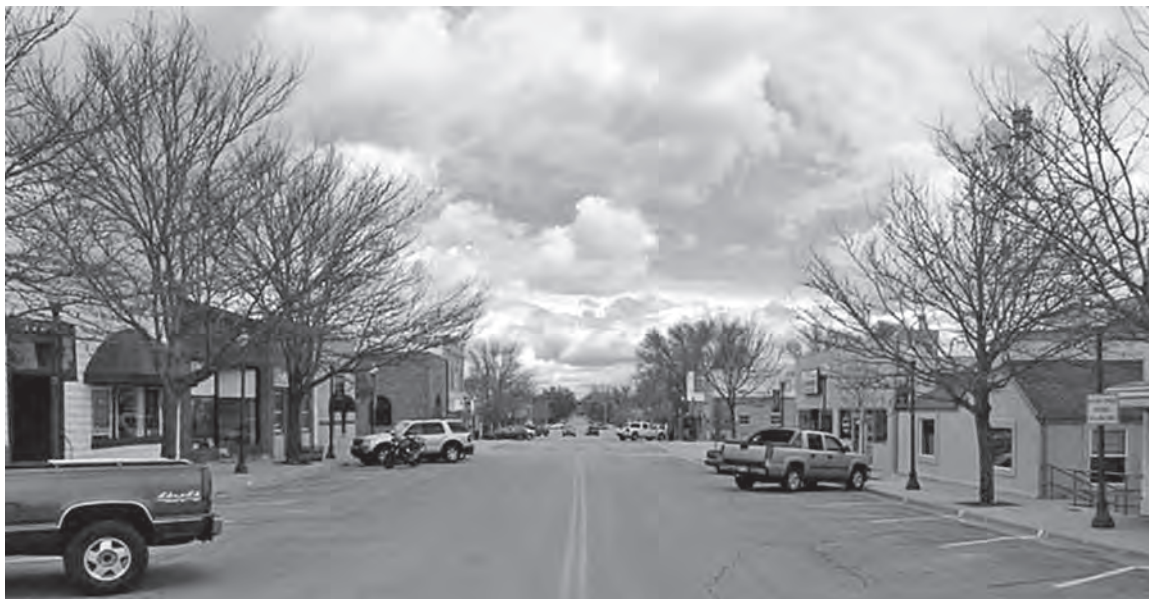
Limon, Colorado i dag.

har modtaget billeder af søsteren og dennes familie, der pænt er blevet sat i ramme i hjemmet i South Dakota: »I ser godt ud alle sammen, men jeg kjendte ingen af Eder. Du vil jo synes, kjære søster, at jeg burde kjende dig, du må betænke, at det er 32 år siden jeg så dig, du var 21 år og nu er du 53.«