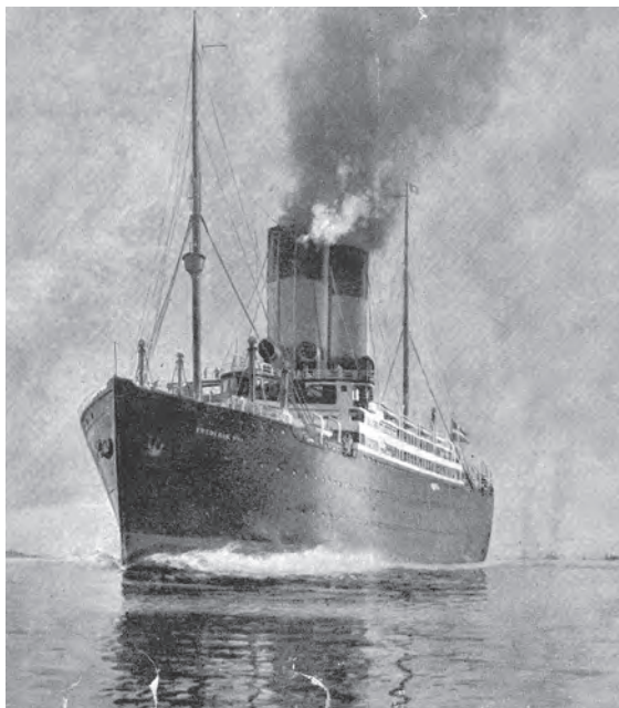
Damperen Frederik VIII sejlede 1914-35 i fast rutefart på Skandinavien-Amerika Linien og bragte tusindvis af udvandrere til det forjættede land.

bosatte sig i det lidt koldere midtvesten i Wisconsin og Illinois, hvor de havde nemt ved at tilpasse sig klimaet. I 1860, lige inden borgerkrigen brød ud, var der over 70.000 skandinaviske immigranter i USA. De var naturligvis efterhånden en blanded gruppe, men med en overvægt af landbrugsfamilier, og skandinaverne markerede sig med deres skoler og deres aktive deltagelse i demokratiet.