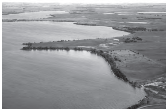
Lake Norden, South Dakota – også en populær destination for thyboer.

Egentlig kan skandinavernes tilstedeværelse spores tusind år tilbage i Nordamerikas historie. Vi ved fra arkæologiske fund i bl.a. Newfoundland, at vikingerne besøgte den nordamerikanske østkyst gentagne gange fra omkring år 1000, i den periode, hvor de koloniserede Grønland. I det 17. århundrede var skandinaver til stede som nogle af de første nybyggere, hvor svenskere og finner i 1638 grundlagde et område kaldet »New Sweden« i det nuværende Delaware på USAs østkyst. De var gode til at tilpasse sig livet i vildmarken og skoven, især