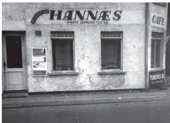
Hannæs ved »lukketid« i 1962.