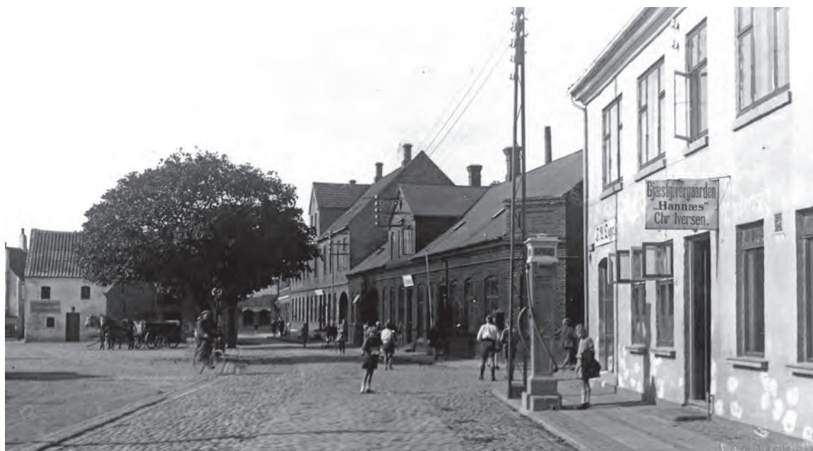
Gæstgivergården Hannæs omkring 1928.