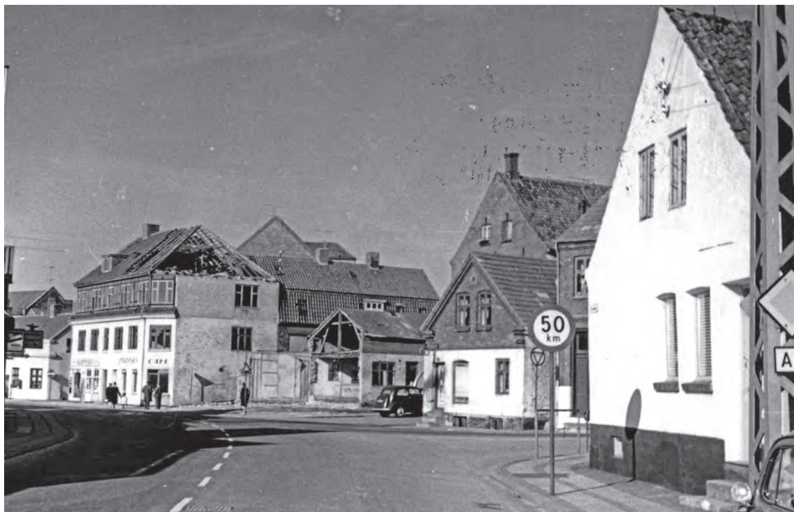
Et kig hen mod Strandgade 7 før nedrivningen i 1963. Hovedvejen går fortsat ud forbi slagteriet, og biler fra Østerbakken måtte standse op ved et skilt med »fuld stop«.