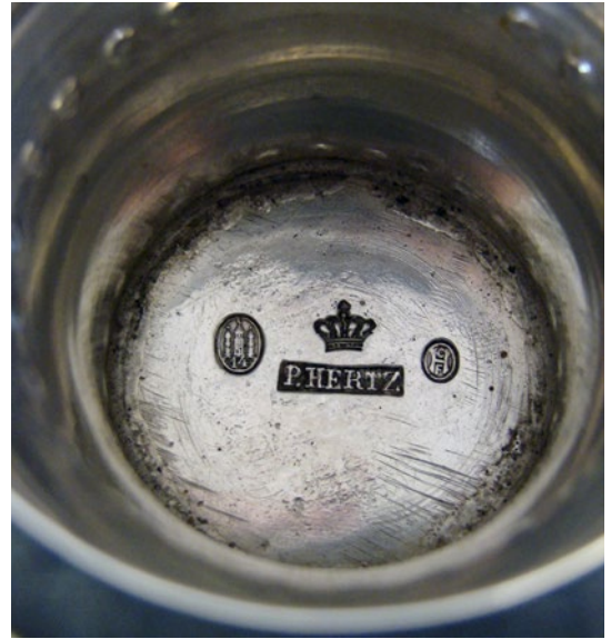
Under bægerets bund viser stemplerne, hvor og hvornår bægeret er fremstillet.

metallets kvalitet. Bægeret er et smukt eksempel på det ændrede udtryk, erkendtlighedstegnene fik efter 1892.