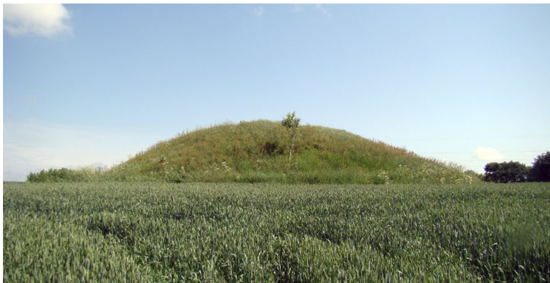
Storhøj i Skyum, fredet i 1912.