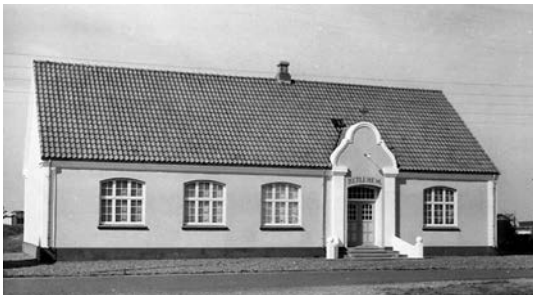
Missionshuset »Bethlehem«. Klitmøller fik sit første missionshus i 1899, men det blev hurtigt for lille, og »Bethlehem« blev opført 1919.