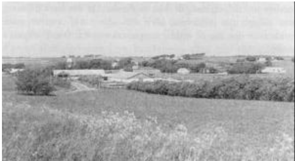
Skinnerup, set fra syd 1976.

En anden gammel landevej gik fra Thisted til Klitmøller. Den gik ud ad Tingstrupvej, fortsatte op forbi Klatmølle i Torsted og derfra tværs over heden og Hjardal, forbi Store Tøfting i Øster Vandet og videre til Vester Vandet og Klitmøller i en næsten lige linje fra Thisted. Den gik ikke gennem Skinnerup, men dannede skel mellem Skinnerup mark og Torsted mark.