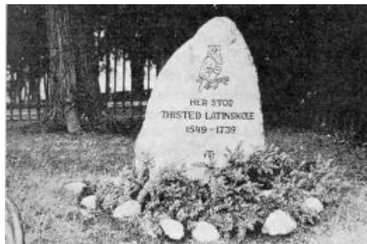
Kirkens skole og klokkerbolig.

På dette sted er en sten med indskriften: "Her stod Thisted Latinskole 1549-1739" nu det eneste minde om den gamle skole, hvori så mange drenge fra Thisted og fra omegnen gik de første møjsommelige skridt hen ad lærdommens trange vej.