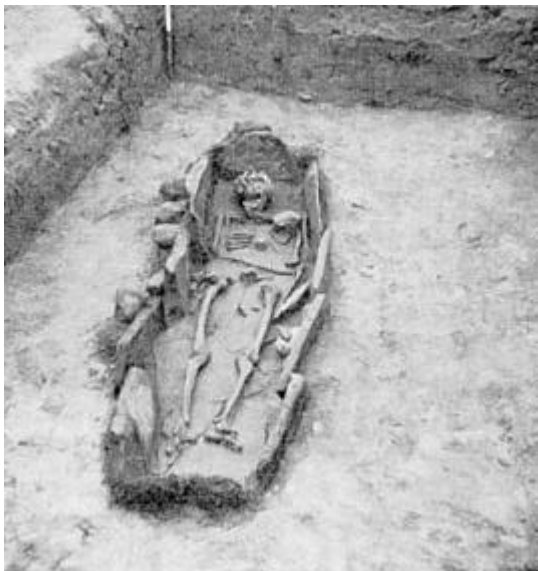
Højsager grav nr. 3.

Når dette har kunnet konstateres skyldes det, at knoglerne var så velbevarede. Højsager udgravningen blev