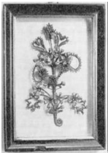
Mindebuket af hår.