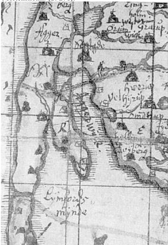
Johs. Meyers kort ca. 1650.

Mortensholm og den sydligste Flegbusken. På intet af disse kort er der angivet bebyggelse på øerne, men på kortet 1695 findes byen Nabe ved et lille næs sydvest for Mortensholm. (S. 278).