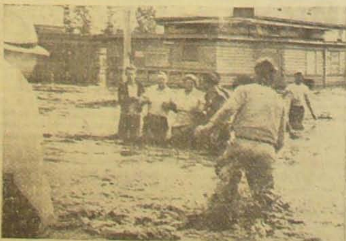
OVERSVØMMELSERNE I OREGON har endnu ikke trukket sig tilbage. Daglig reddes Mennesker, der har været i Livsfare i adskillige Dage. Her er en Situation, hvor Redningsmandskabet naar frem i rette Tid.

Det danske Svar blev som bekendt — som det maatte blive — et Afsag. I Svaret hed det til Slut: »En Iværksættelse af de fra tysk Side krævede Foranstaltninger vilde ødelægge Regeringens Muligheder for at holde Befolkningen i Ro, og Regeringen beklager derfor, at den ikke kan finde det forsvarligt at medvirke til Gennemførelsen af disse Foranstaltninger.