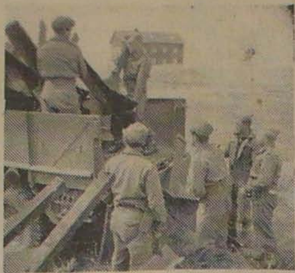
Tankkrydsene læsses paa Lastbil.

Foreløbig er Agger og Agger Tange rensset — Forhandlinger mellem Hæren og Marinen om Resten