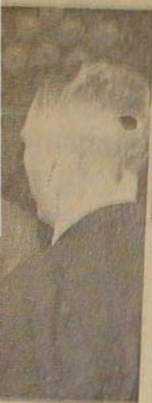
sendt en 5 Krone-gaa til Kongens Portræt af Kon- sminister Erlan- fotografiet.

g, maa fortsætte men gaar de over atter, skal Resten