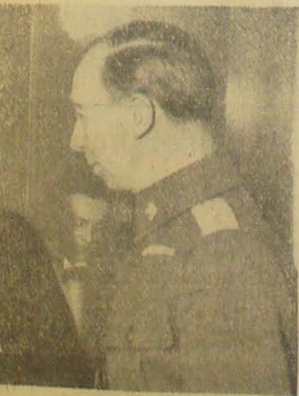
la maatte Trygve Løe mellemlande i København konferere med Udenrigsminister Gustav under Samtalen, Udenrigsministeren iført kan bar under Konferencerne i London.