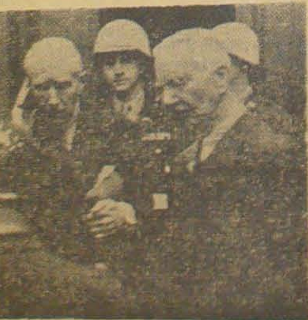
Dr. Schacht, Papen og Fritsche har et dets Ledelsesspiser.