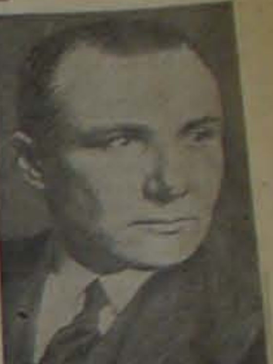
Figurledet Martin Bormann skal fortælle alle den Tysklands Regering om Krigens, der nu har faaet Tysklands Regering til at foretage en undersøgelse af Bormanns Hæder personlig.

Til "Nationaltidende" indgives beretninger fra Berlin: Det fortjener at bemærkes, at der fra autoritativ Side i Berlin set på nærværende Tidspunkt tales om store Begivenheder, der i en nær Fremtid vil beskæftige hele Verden. Hvilke Begivenheder det drejer sig om, kan naturligvis ikke forudsiges, men man forestaar paa alle de i Berlin foreliggende Antydninger, at det maa være selve Størpolitikken og Krigens Udvikling, der sigtes til. Der vil meget snart fremkomme Meddelelser, der vil faa Hess-Sagen til at bølge fuldkommen, pointeres det i Berlin.