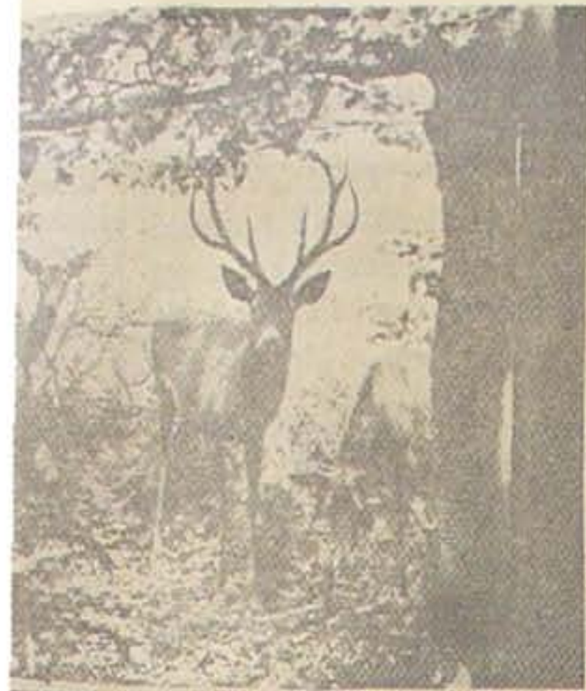
ed en Gruppe af Hjorte i Udkanten af en Skov.

— I vor Læsekreds var der endvidere Luftalarm i Nykøbing.