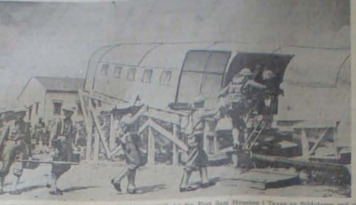
Overalt i U. S. A. udføres store Militærøvelser. På Billedet fra Fort San Houston i Texas er Soldaternes ved at indøve hurtig Indtægning i Flyvemaskine, med Maskingevær og anden nødvendigt Urust. "Maskinen" er kun en Flyvemaskinprop, bygget specielt til Udvælsøvelser.