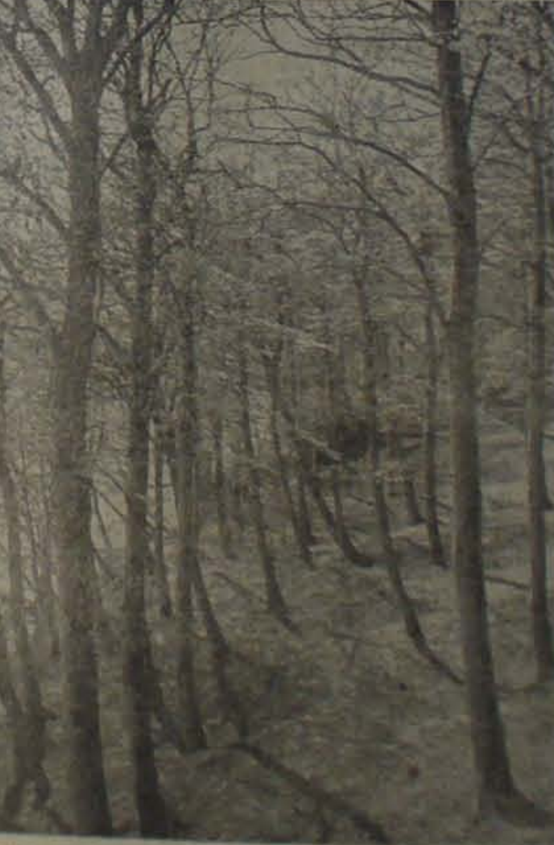
Billedet fra en Skov paa Fyn, taget i Tirsdag, da Bogen var ved at falde deres Bløde ud.