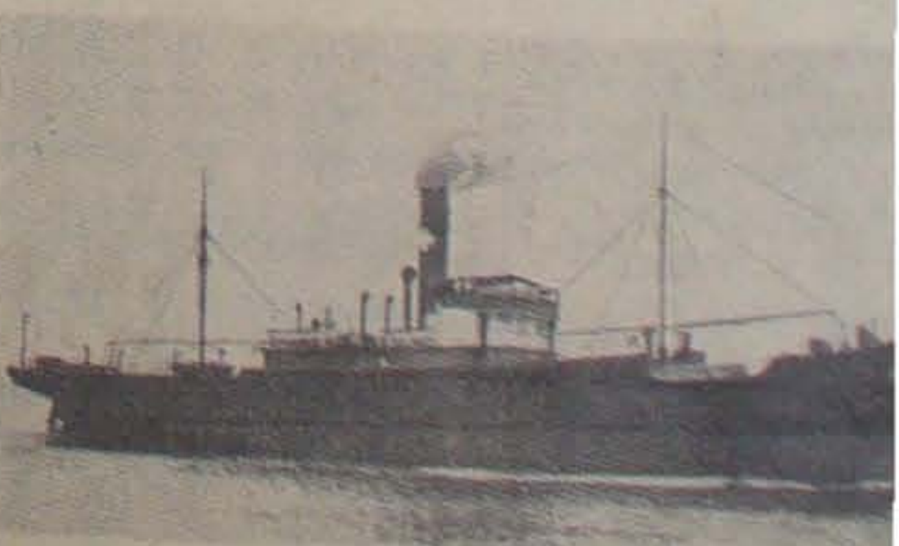
S S. »Paris«, Dampskibsselskabet »Pacifac«, som er strandningen reddet.

I Anledning af forskellige Forespørgsler erfarer RB. serne om, at de danske Skibe