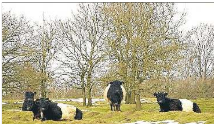
NATURPLEJE KAN bidrage til at skaffe landmændene flere indtægter, især landmænd med lette og hårdføre kvægracer som bl.a. Galloway.

Mødet holdes onsdag aften 24. februar. Det er arrangeret af Biologisk Forening for Nordvestjylland (BFN) i samarbejde med LandbøThy og Landbo Limfjord og med støtte fra LAG Thy-Mors. Mødet er åbent for alle og henvender sig især til landbrugere og naturinteresserede.