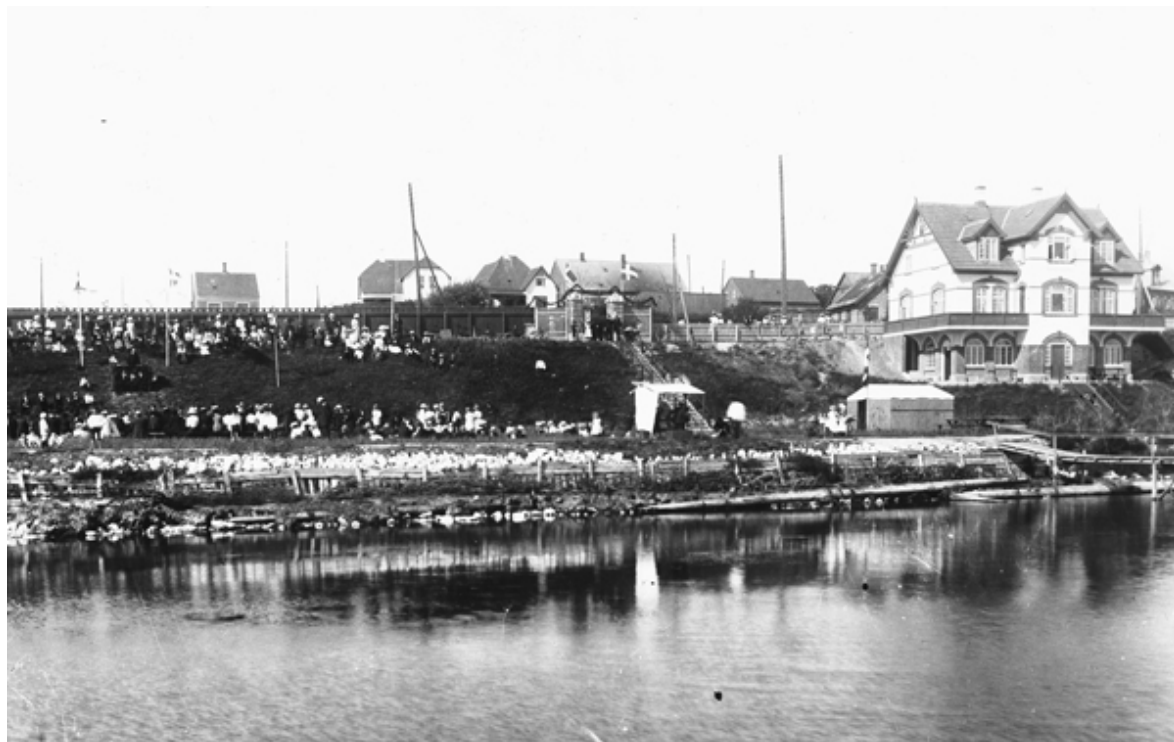
Dragsbæk var et populært rekreativt område i 1930'erne.