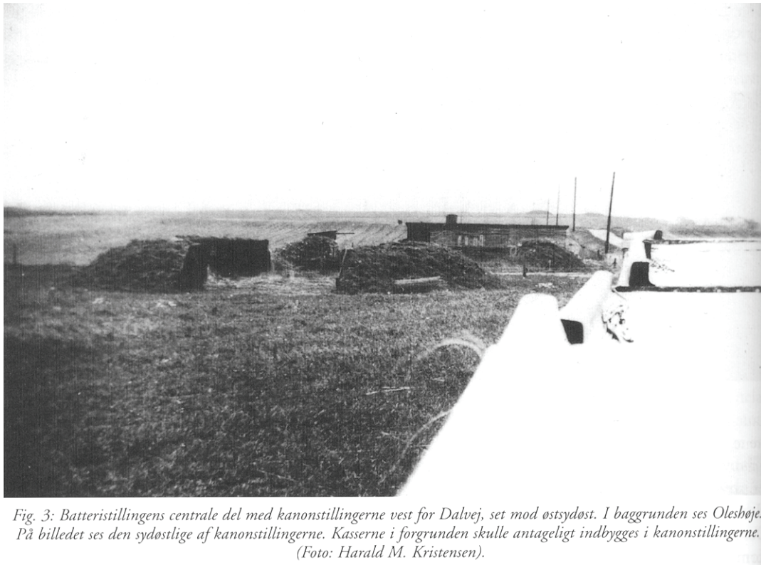
Fig. 3: Batteristillingens centrale del med kanonstillingerne vest for Dalvej, set mod østsydøst. I baggrunden ses Oleshøje. På billedet ses den sydøstlige af kanonstillingerne. Kasserne i forgrunden skulle antageligt indbygges i kanonstillingerne.

1945 er der således ikke det fjerneste at se.