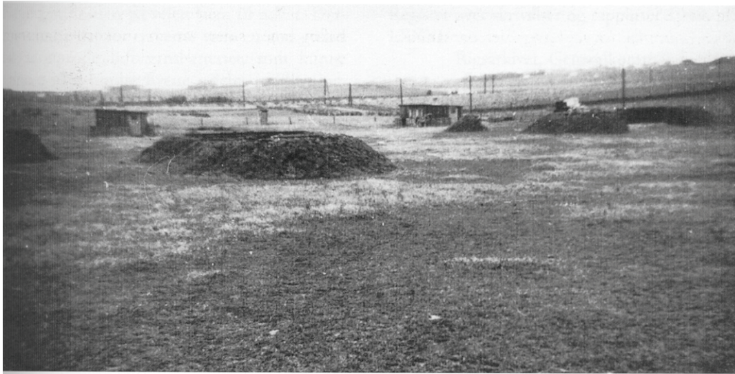
Batteristillingens centrale del med kanonstillingerne vest for Dalvej, set mod nordøst. På billedet ses de to nordlige kanonstillinger og den sandsynlige ildledelsestilling midt i anlægget.

politimesteren, at der var opført 5-6 kanonstillinger og ca. 7 barakker i området samt på hvilke gårdejerens jord, det var sket. Anlægget var da formodentlig færdigt.