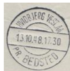
Museumsaftryk af første pr-stempel.