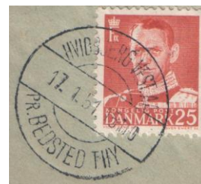
De to pr-stempler med henholdsvis Aa og Å.