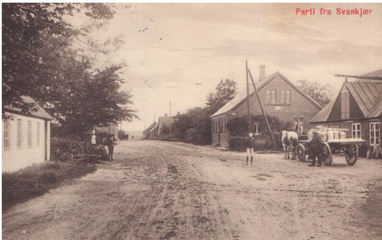
Postkort fra Svankjær som er den ”nye” benævnelse for Hvidbjerg Vesten Aa.

Stemplet har nemlig stedsbetegnelsen Hvidbjerg Vesten Aa pr. Bedsted, og da der er flere steder i kongeriget, der hedder Bedsted, skal adressen være pr. Bedsted Thy. Derfor bliver der omgående bestilt et nyt stempel med rette stedsbetegnelse. Dette stempel kendes brugt fra slutningen af 1948 og frem til 1957, hvor man ”går fra” dobbelt a til bolle-å. Det betyder, at nu skal der i stemplet stå Hvidbjerg Vesten Å pr. Bedsted Thy. Dette stempel er i brug frem til brevsamlingsstedet bliver nedlagt i 1964.