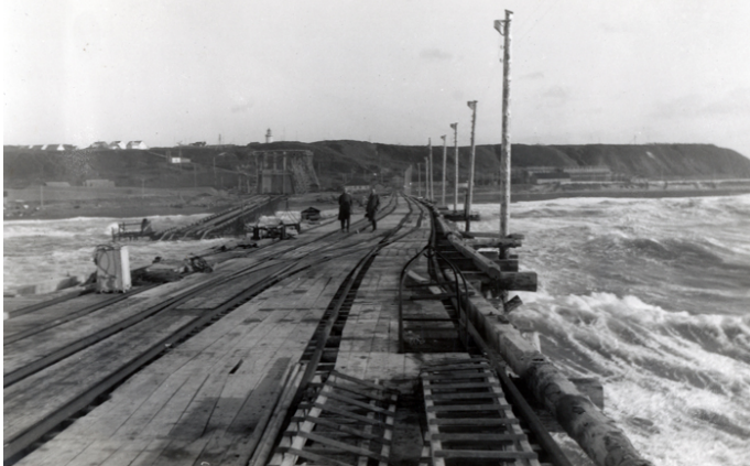
Hanstholm Havn under opførelse - byggeriet er gået i stå.