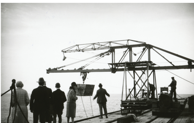
Da havnebyggeriet endnu var i gang og altid et besøg værd.