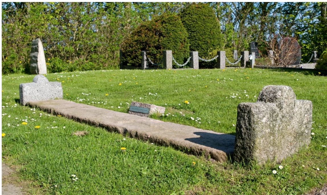
Liden Kirstens grav, lige nord for kirken.

På kirkegården nord for Vestervig Kirke ligger der tæt ved skibets nordvestlige hjørne en sælsom, gammel gravsten. Den 3,4 meter lange og blot 0,5 meter brede gravsten af granit er dateret til omkring år 1200. Stenen er udsmykket med to kors i forlængelse af hinanden, samt et tekstbånd langs kanten. Teksten er nu ulæselig, men blev afskrevet af Peder Resen tilbage i 1680'erne, og en kontrol med endnu