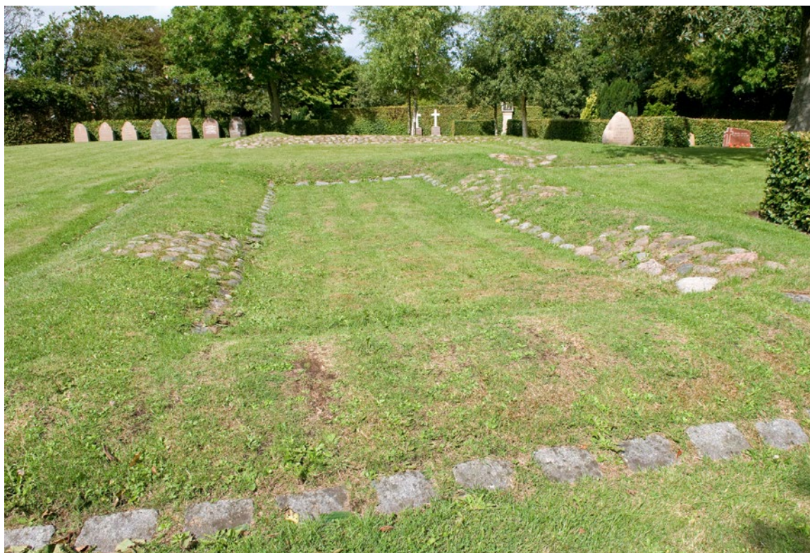
Omridset af den oprindelige sognekirke er markeret på den nuværende kirkegård.

De første reelle belæg for eksistensen af et religiøst konvent af nogen slags i Vestervig er fra midten af 1130'erne, og først noget senere tales eksplicit om et egentligt kloster. I tiden omkring 1135-36 indgik et præstefællesskab i Vestervig blandt de gejstlige institutioner, som kannikkerne ved domkapitlet i Lund havde et forbønsbroderskab med. I Roskildekrøniken berettes det desuden, at der blandt de faldne biskopper ved slaget i Fodevig 1134 var en »Kjeld af Vestervig« ( Ketillus Westeruicensis ); den bispe-lige betydning af denne omtale behandles nedenfor, men samlet indikerer de to belæg eksistensen af et konvent af præster, kannikker eller munke i Vester-