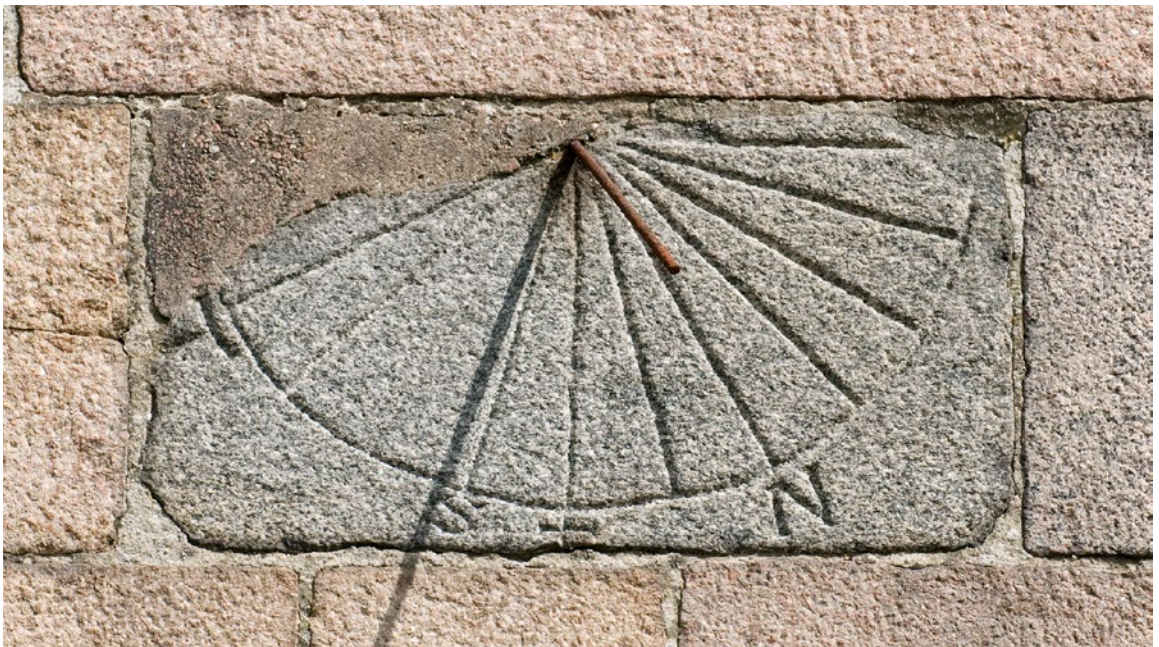
Solur på sydmuren af kirkeskibet med angivelser af de kanoniske tider, dvs. tidspunkterne for munkenes daglige bønner. Uret er lige så gammelt som kirken og muligvis det ældste solur i Norden.

Længe var den af historikerne ældst kendte reference til Børglum som bispesæde fra 1139, hvor biskop Sylvester kaldte sig Burglanensis episcopus ; derefter skrives bisperne konsekvent op gennem 1100-tallet som værende »af Børglum«. Bortset fra Knyttingsaga, så tales der ingen steder i kilderne eksplicit om et ældre sæde for biskoppen, ej heller omtales en flytning af sædet til Børglum. Når A. D. Jørgensen og mange efter ham alligevel mente, at dette måtte være tilfældet, skyldes det en omtale i Roskildekroniken fra omkring 1140, der blandt de