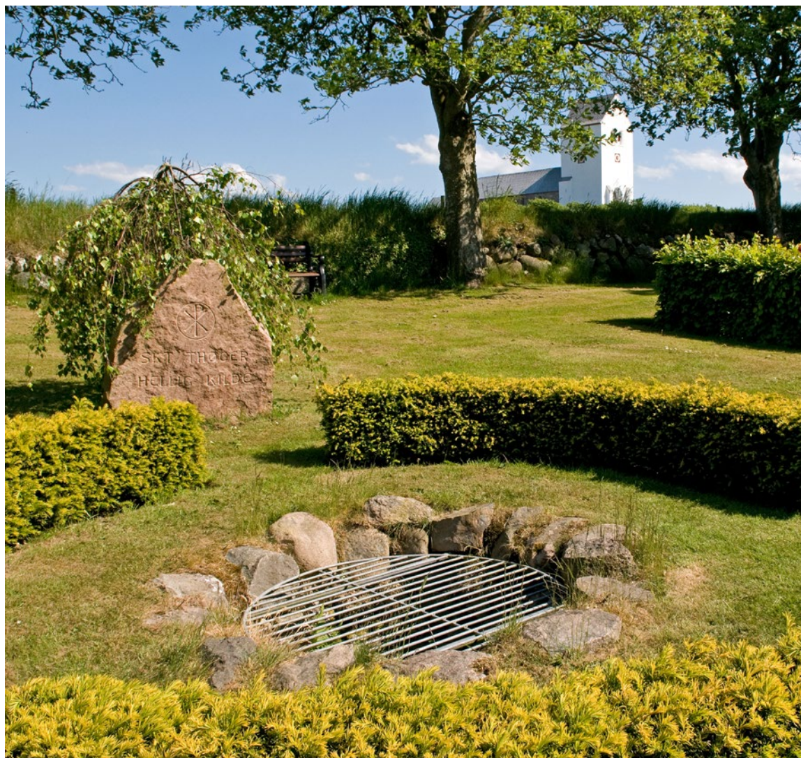
Skt. Thøgers Kilde, hvis vand siges at have helbredende virkning.

vig, senest fra engang i første tredjedel af 1100-tallet. Til trods for omtalerne i Lundenekrologiet 1 og Roskildekrøniken i midten af 1130'erne, så mener Tore Nyberg i en senere behandling af spørgsmålet alligevel, at » a community can hardly have existed there that early «, hvilket især bygger på, at klosterkirken ud fra sin arkitektur formentlig er fra anden halvdel af 1100-tallet (Nyberg 2000: 164).