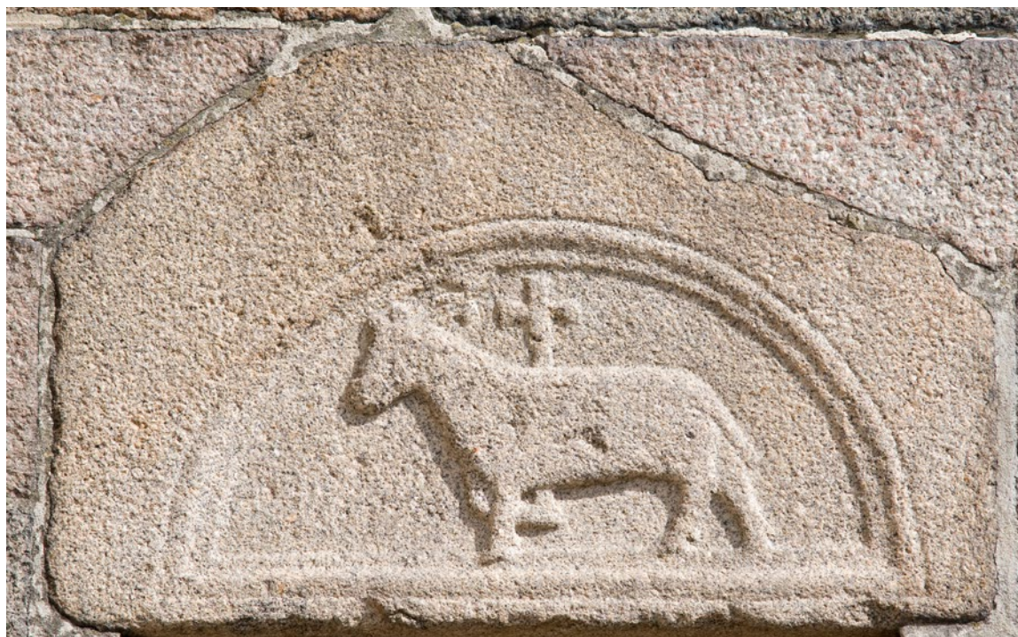
»Skt. Thøgers Vartegn«. Relief på sydsiden af kirkens kor, flyttet fra den oprindelige sognekirke.

Den vel nok mest udbredte og sejlivede (eventuelle) myte omkring Vestervig er, at klosteret var hjemsted for det oprindelige nordenfjordske bispesæde ved Danmarks stiftsinddeling fra omkring 1060, indtil biskoppen i 1120-30'erne flyttede sin residens til Børglum. Forestillingen er faktisk ikke så gammel