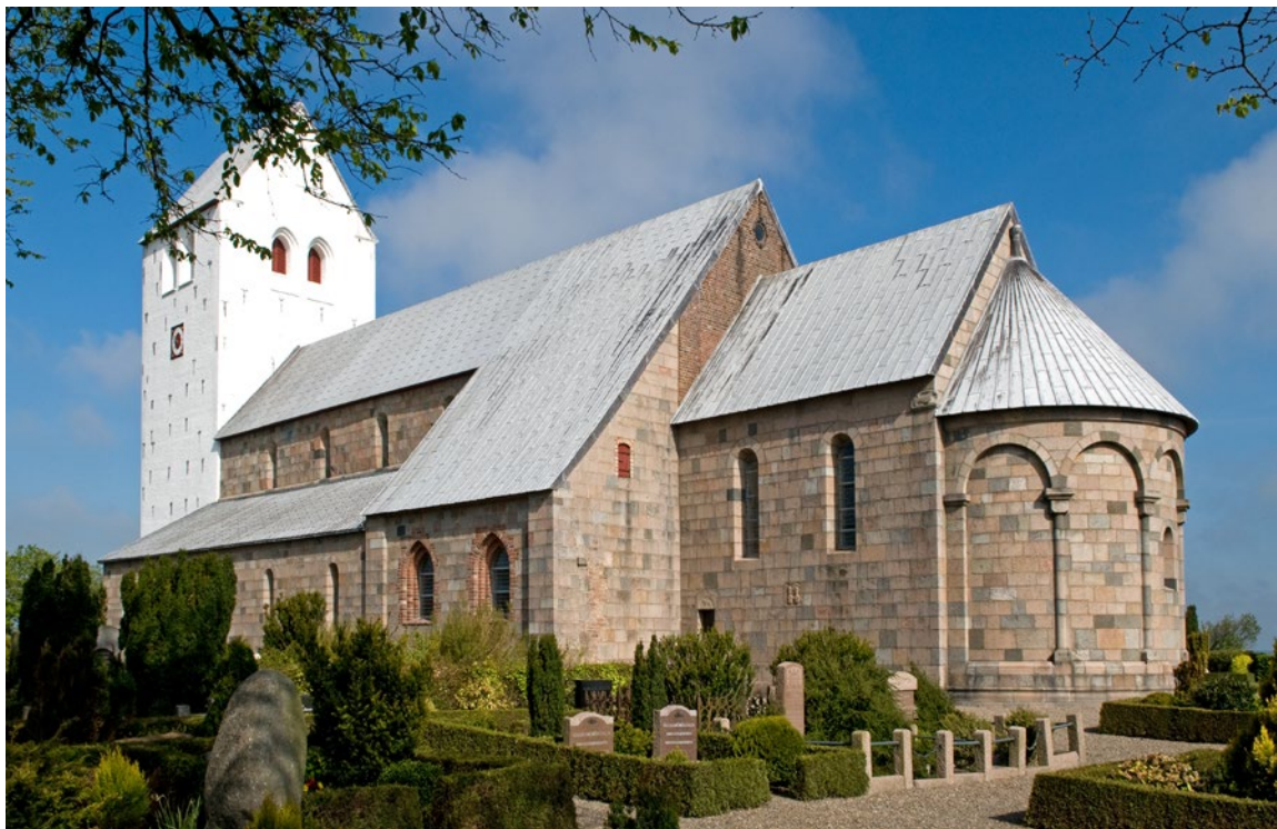
Vestervig Kirke. Indtil reformationen klosterkirke, i dag Danmarks og muligvis Nordens største landsbykirke.

Men selv set i dette almindeligt udbredte tågelys har ét klostres historie vist sig ekstraordinært bøvlet at få rede på: Vestervig Kloster. Hvad der flyver rundt i litteraturen af varierende årstal og hændelser