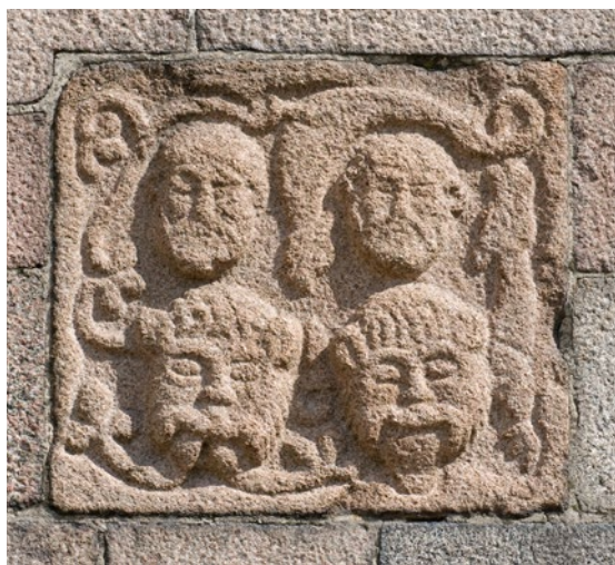
Relief på sydsiden af koret. Ifølge den lokale overlevering henviser det til en episode med to munke og to nonner, der blev muret ind i kirkemuren som straf for hor.

Et i litteraturen ofte omtalt forhold fra Vestervig Klosters ældste historie gælder en beretning om, at der i 1180'erne skulle have fundet et særdeles utugtigt levned sted ved klosteret. Sagen, der i nyere tid er udførligt beskrevet i nærværende årbog af Else Bisgaard (2008), tager udgangspunkt i de ovenfor omtalte breve bevaret gennem Abbed Vilhelms Brevsamling. De to breve er begge skrevet af abbed