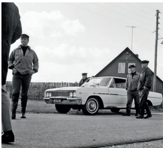
Morten Grunwald (forrest) og Arthur Jensen (bagest ved bilen) overbeviser ikke i rollerne som vesterhavsfiskere i Stenbjerg. De tager til gengæld senere revanche i Olsen Banden og tv-serien Matador. Og for Arthur Jensen også som vicevært i et berømt hus på Christianshavn.

være med til at lade dyden gå amok», som Thisted Amts Tidendes udsendte lettere beroligende beretter fra Stenbjerg.