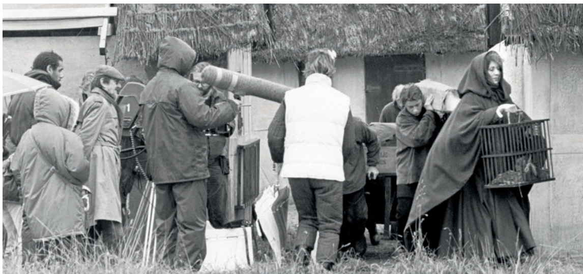
Klar til optagelse! Instruktøren Gabriel Axel ses som nr. tre fra venstre ved kameraet. I spidsen for »optøget« Babette, der bringer de franske delikatesser i hus. I hånden bærer hun et bur med vagtler, der må ofres på hendes kogekunstneriske alter. Et nyligt afdød pragteksemplar af en skildpadde fra dybfryseren på Zoologisk Museum bliver bragt til Vigsø som en vigtig rekvisit. Hovedingrediensen i Babettes franske suppe er skildpadde. Babette spilles af den franske »stjerneskespiller« Stéphane Audran.