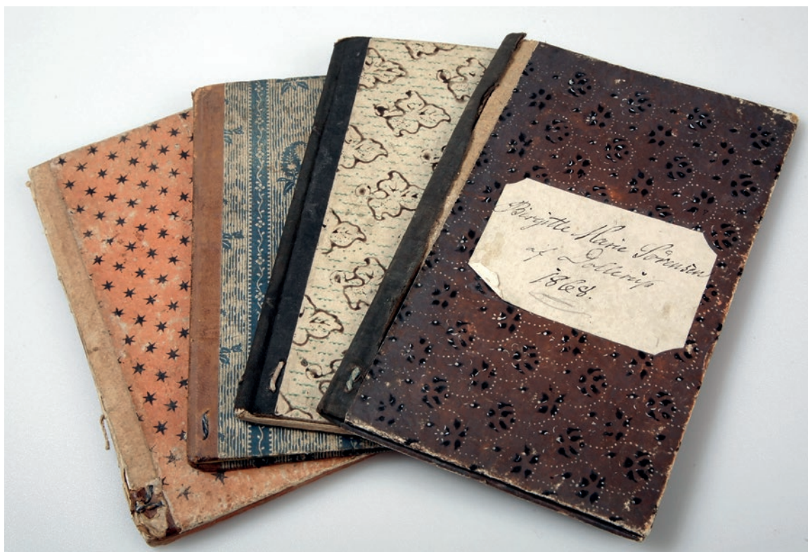
Et udvalg af skudsmålsbøger fra museets samling.