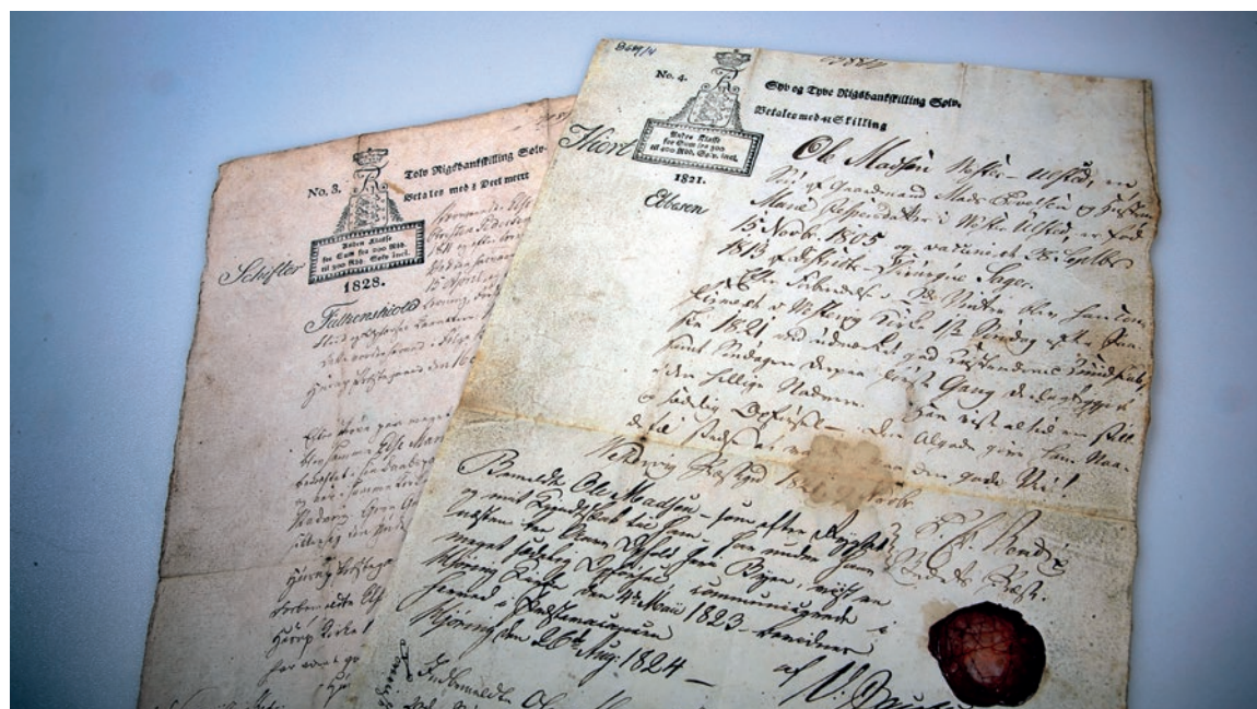
Skudsmål i løse ark, først i 1833 blev skudsmålsbøgerne indført.