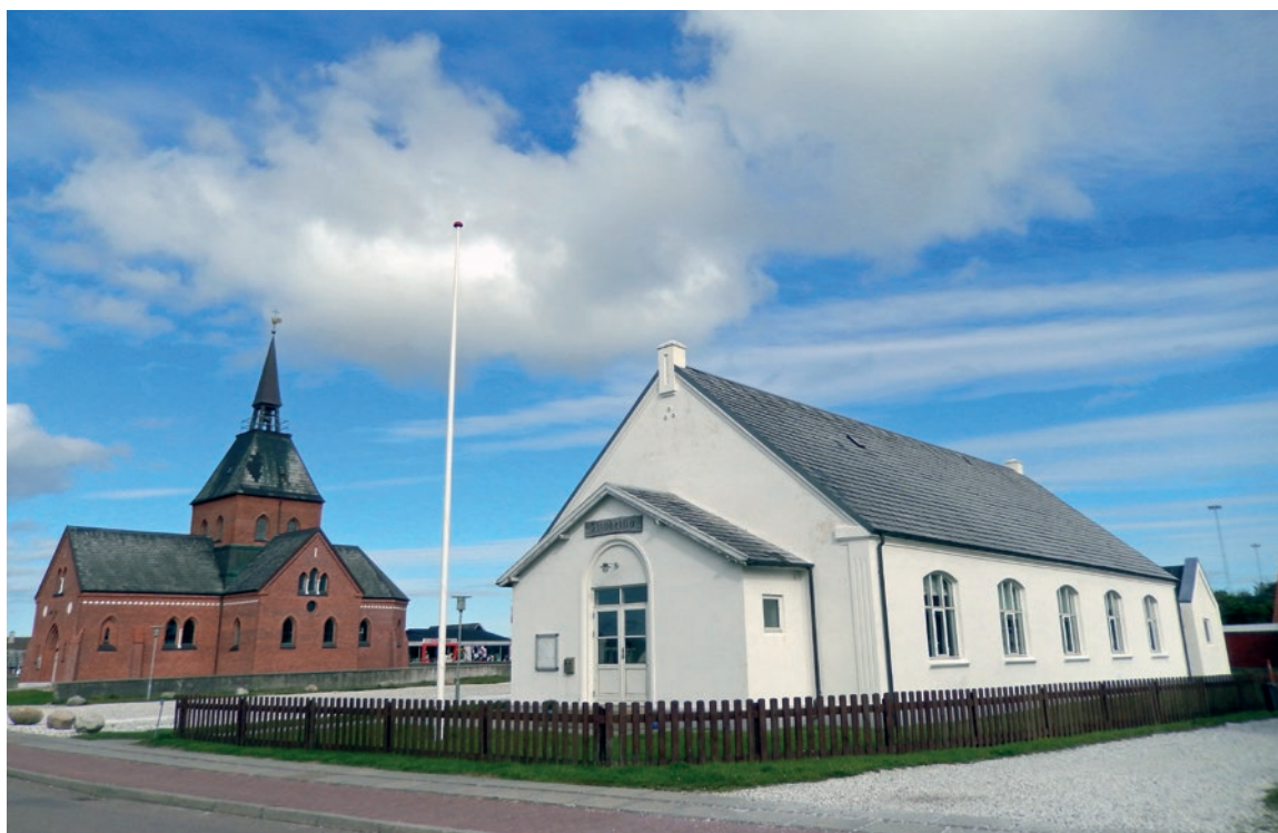
Missionshuset Filadelfia i Nørre Vorupør, som det ser ud i dag.

Trøst paa saadanne Ture at vide sig beskyttet af Jords og Havs højeste Kraft, aldrig at føle sig ene, men tro sig beskuet af et evigt vagtsomt Faderøje, nære en uomstødelig Tillid til, at intet skete, som ikke var Herrens Vilje, og at Herrens Vilje evig og altid var den bedste, den eneste rette.«