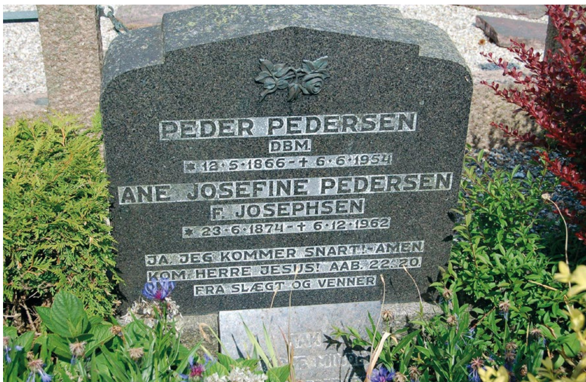
Per Knudsens gravsted på Vorupør Ny Kirkegård 2011.

lykkedes det dem at åbne op for omvendelse af befolkningen i disse fiskerlejer.