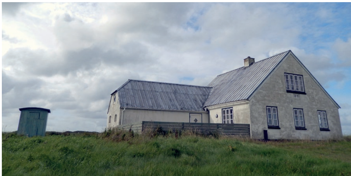
Strandvagtsskur i Sønder Vorupør 2015. Skuret blev købt i 1960'erne af husets nye ejer, da det ikke længere blev anvendt. Tidligere stod det ude i klitterne ved Sønder Vorupør, nær stranden. Huset blev bygget i 1897.