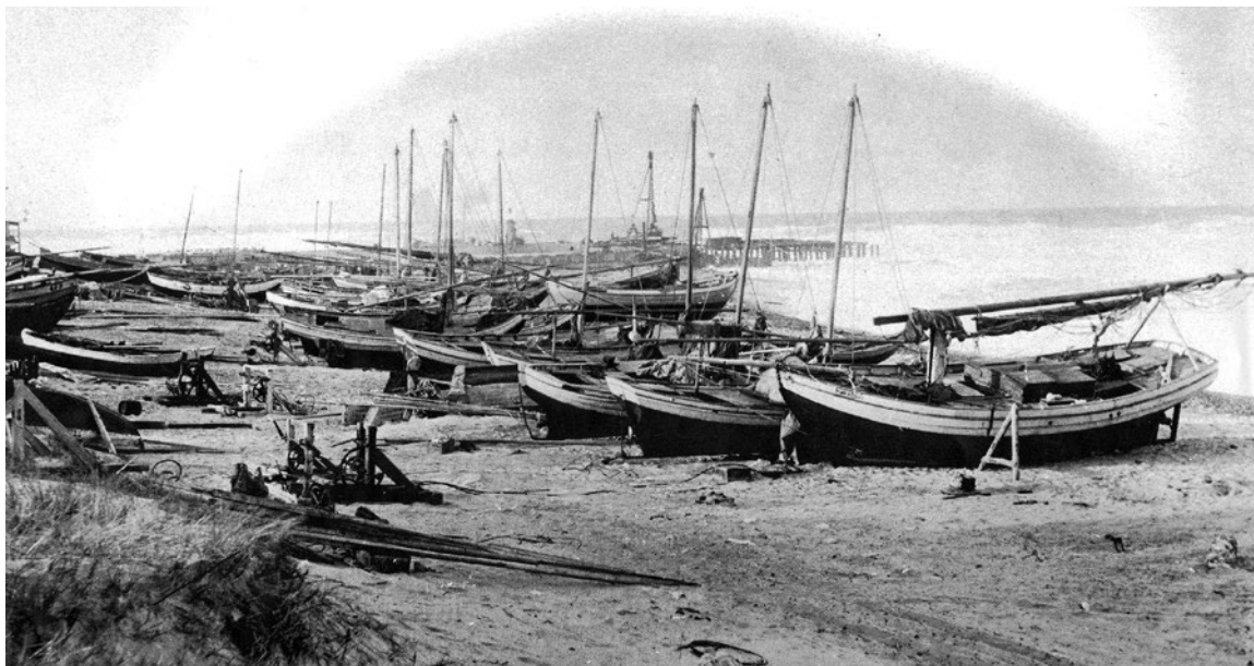
Vorupør landingsplads i foråret 1907. Modsat da Mylius-Erichsen var på besøg i 1901, så er molebyggeriet nu kommet i gang.