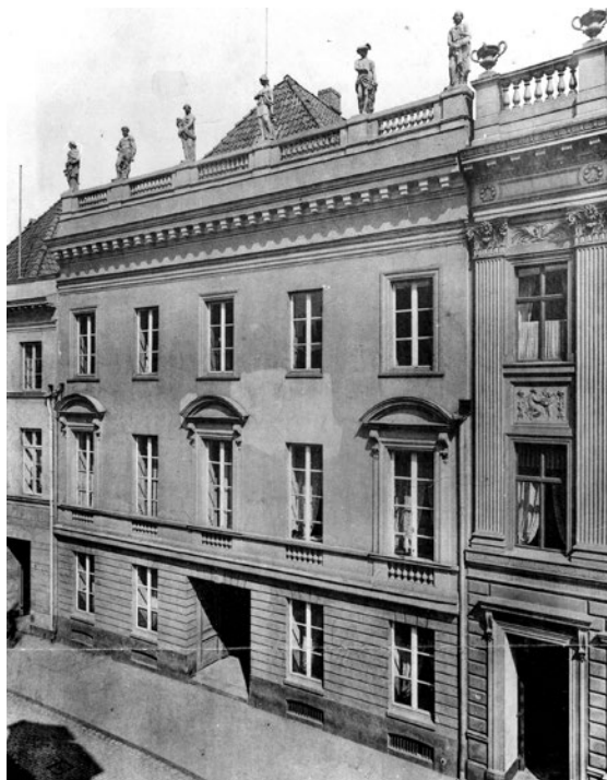
Behnhaus i Lübeck, ca. 1920.

Heise anmelder udstillingen i det danske tidskrift Samleren og illustrerer sin artikel med ikke