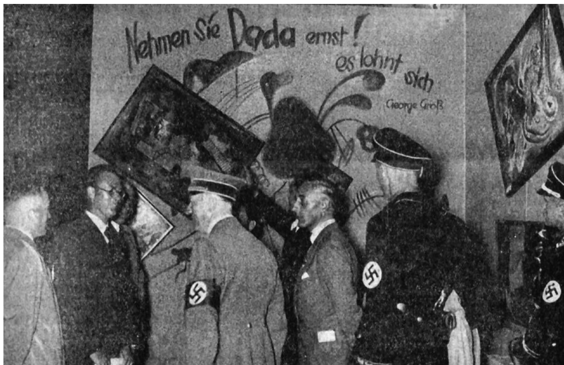
Lidet attraktiv ophængning fra »Entartete Kunst«-udstillingen i München.

Jens Søndergaards Aften ved Havet kom også i 1939 tilbage til kunstneren, hvor det efter datteren