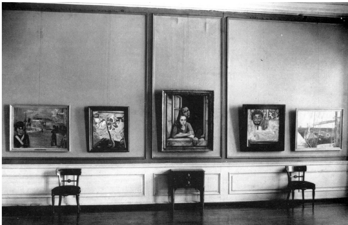
Fem af Heises nyerehvervelser fra 1920'erne. De fire blev erklæret »entartet« 14. juli 1937. Noldes Stilleben (nr. to fra højre) blev udstillet i München, solgtes via svogeren Aage Vilstrup til Nolde, igen beslaglagt og endelig destrueret i 1945.

Kunst«. Kernen i museets samling af moderne kunst (se ovenfor) blev beslaglagt sammen med museets stolthed, tre oliebilleder af Edvard Munch, samt en finsk og en belgisk kunstners arbejder, hvilket egentlig var i strid med opgavens geografiske afgrænsning. Søndergaards billede blev, uvist af hvilken grund, fredet.